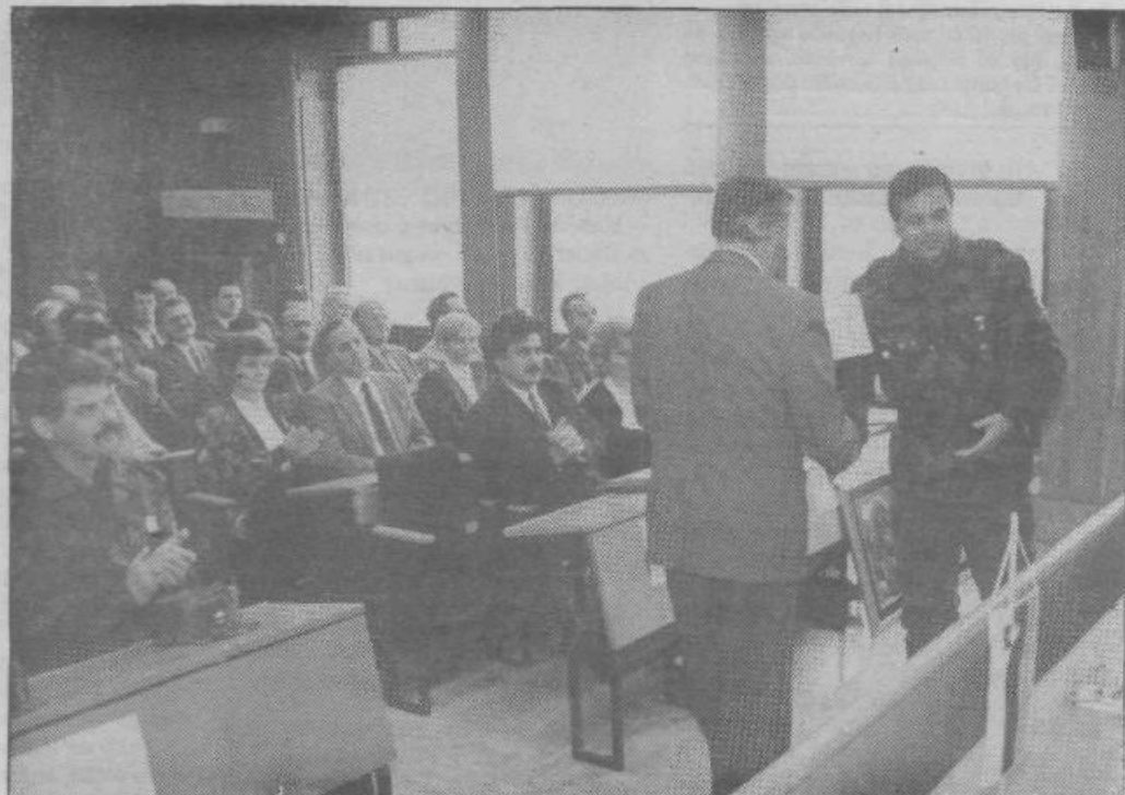
Na slovesni seji občinske skupščine, ki je bila v sredo, 22. aprila 1992 so podelili tudi deset zahval TO Republike Slovenije. Prejeli so jih nekatere krajevnih skupnosti, kolektivi in posamezniki.