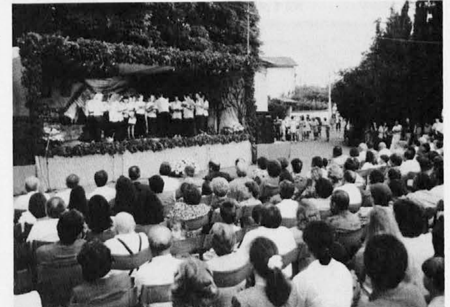
Slovesnost na trgu v Mavhinjah