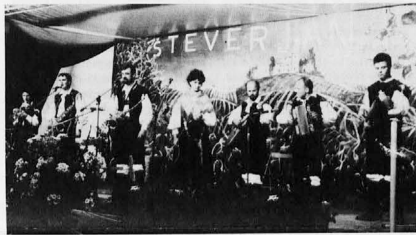
Prizor z letošnjega festivala