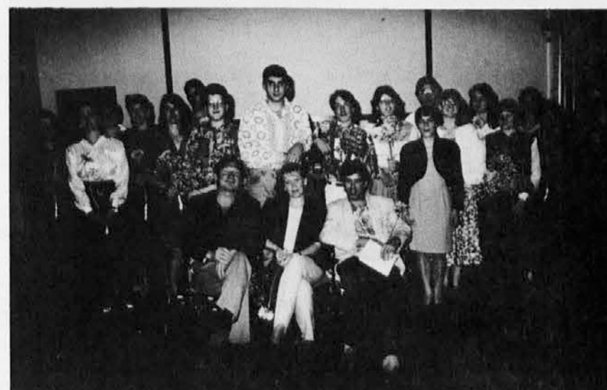
Nastopajoči v Galeriji zvokov z učitelji in tajnicama