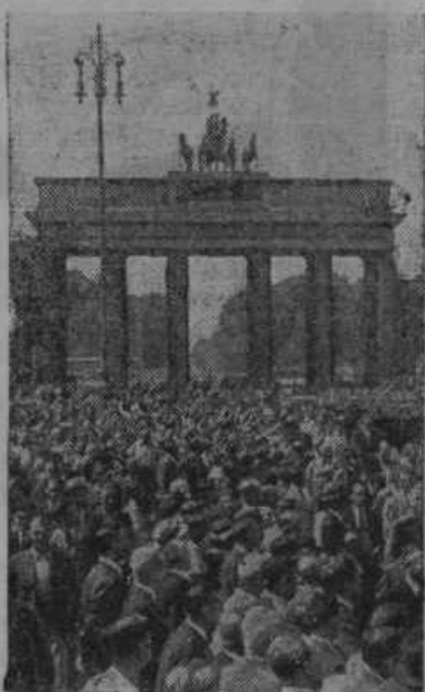
Berlin bo slavil letos 700 letnico. Na sliki vidimo znamenita brandenburška vrata v Berlinu.