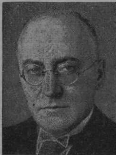
Bivši nemški ministrski predsednik dr. H. Brüning se je vrnil iz Amerike na Angleško, kjer bo imel na vseučilišču v Oxfordu predavanja.