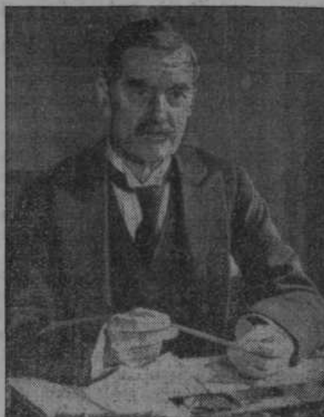
Novi angleški ministrski predsednik Neville Chamberlain.

še kos kruha v ustih in so našli tudi v jarku kos kruha. Kruh je znak, da je fant povsem mirno zajtrkoval in niti najmanj ni slutil, da je že bil v objemu strašne smrti. Lokomotiva je zadela ob voz z brzino 80 km na uro. Hlapca je odbil suneč na levo, konja na desno, voz pa je suval stroj naprej, dokler ga ni razmetal na vse strani. Hlapec in konja so bili koj mrtvi.