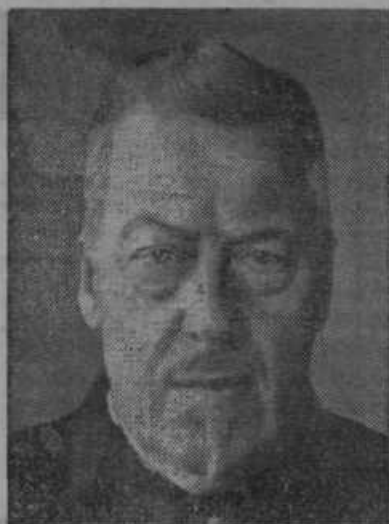
Dr. Hugon Eckener, slavni graditelj nemških zrakoplovov, se pogaja v Združenih državah Severne Amerike za dobavo helijum plina, s katerim bodo za bodoče polnili nemške zrakoplove. Pri heliju je izključena eksplozija.