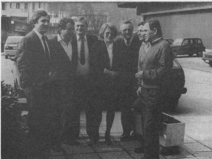
Poslovodje iz Dalmacije v podjetju s sedežem v Splitu.

Iz poslovalnice Vinkovci so prinesli dokaz o bombnem napadu s strelnim orožjem, ki ga ne bi smeli uporabljati. Drobec granate je preluknjal podplat mokašina.