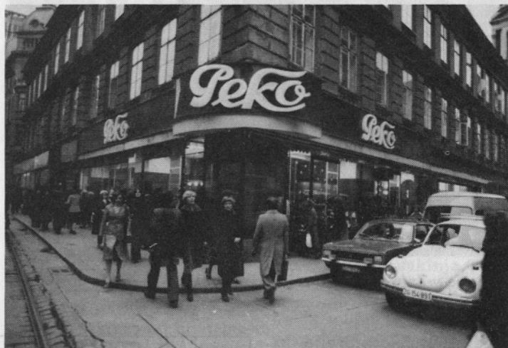
Zagreb: Sedež mešanega podjetja.

Kje dobiti denar, dodatni denar za tekočo proizvodnjo in plačila, ki so z njo povezana? Vsako podjetje in tudi Peko ima lastni kapital (denar), ki je bil porabljen za nakup stavb, strojev, itd. in le manjši del denarja je po stanju konec leta 1991 bilo namenjenega za nakup materialov, itd., za proizvodnjo. To pomeni, da je v vseh naštetih zalogah za dospele račune za material, itd., za izplačilo OD