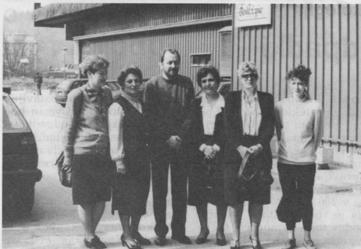
Poslovodje iz Reke in Istre.