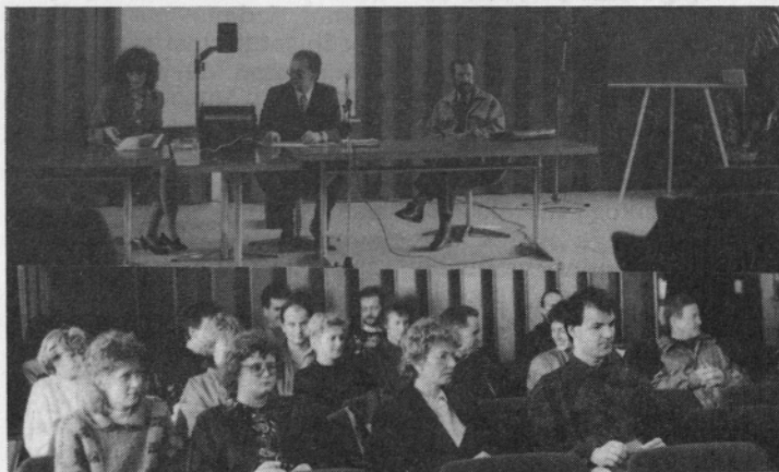
Udeleženci seminarja o industrijski lastnini. Organiziral ga je Izobraževalni center Peko.