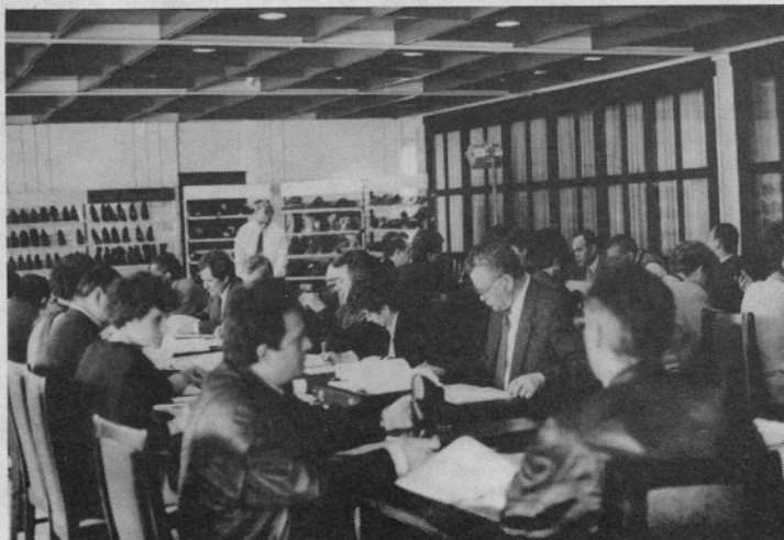
Bazenska konferenca: Naročanje modelov.

V prejšnji številki smo objavili zahteve sindikata s pogajanjem z vodstvom po opozorilnem zboru v montažnih oddelkih 522 in 523. Zahteve sta povzela in pripravila oba sindikata (KNNS in ZSSS) in ne samo sindikat NEODVISNOST, kot se nam je zapisalo v naslovu.