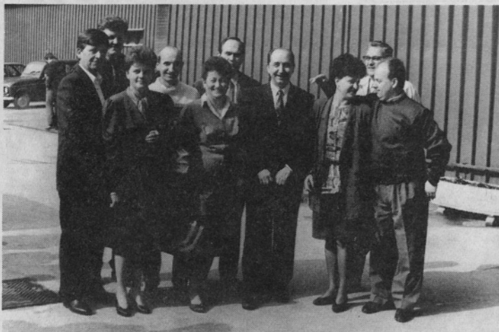
Podjetje v Zagrebu je že registrirano. Poslovodje iz poslovalnic v osrednji Hrvaški.

Mize v dvorani so razporejene v obliki črke U. Na policah v zgornjem delu je razstavljena kolekcija. Poslovo-