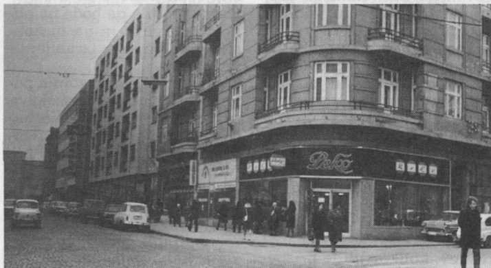
Skopje I. odslej v podjetju PEKO — MAK

Andreji k uspehu čestitamo in želimo še veliko, veliko dobrih metov.