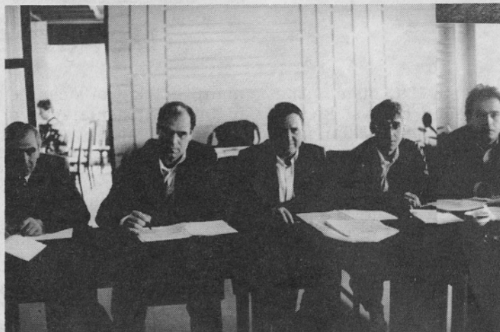
Makedonci bodo združeni v podjetju PEKO-MAK.

izrednih razmer, Srbija in Črna gora pa sta prekinili sodelovanje, tako, da niti ne vemo, kaj se tam dogaja.