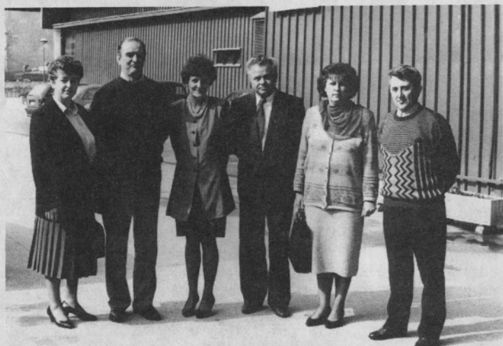
Poslovodje iz podjetja OSIJEK.

Tudi v Makedoniji se pripravljajo na ustanovitev