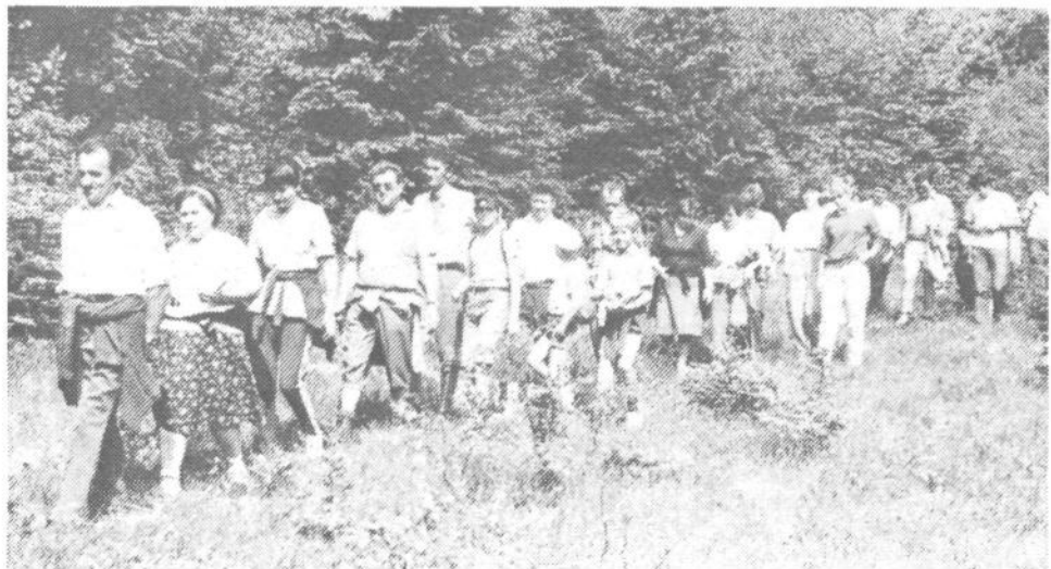
Na jasi pod Kamen vrhom ...