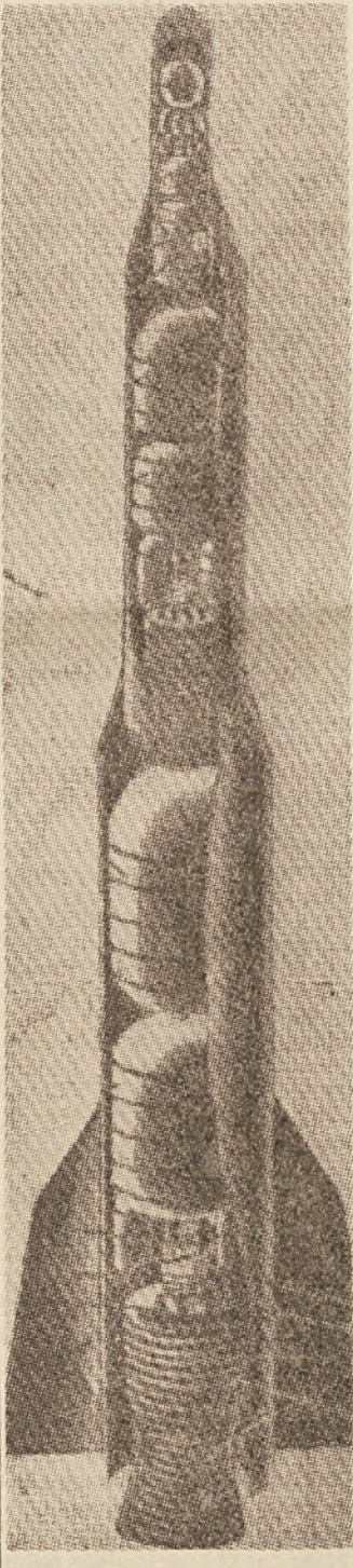
Sovjetski umetni satelit je odnesla v vesoljstvo raketa, ki jo vidimo na naši sliki v prerez. Raketa je sestavljena iz treh delov, od katerih sta prva dva, potem ko sta izbrala gorivo, odpadla, dočim je tretji del odnesel satelit, ki je na vrhu rakete, do njegove krožne poti.

V okviru Tedna muzejev je Muzej narodne osvoboditve v Ljubljani priredil posebno razstavo nedokumentiranih fotografij iz NOB. Razstava ima namen s pomočjo obiskovalcev dobiti čimveč podatkov o razstavljenih fotografijah, ki bodo v bodoče služile kot važni zgodovinski dokumenti v fototeki muzeja. Vsi ljubljanski časopisi so