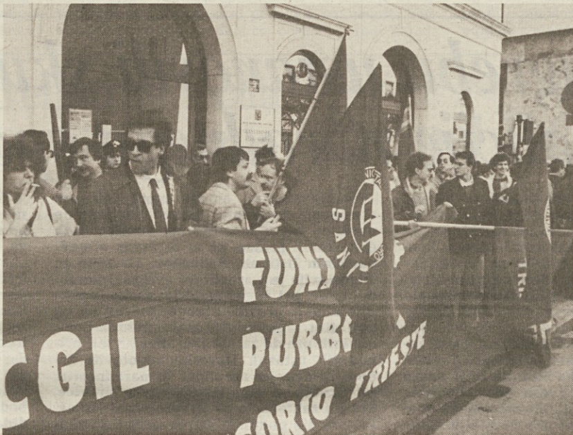
Pred deželnim odborništvom za zdravstvo v Trstu so včeraj protestirali člani sindikalnih konfederacij CGIL, CISL in UIL

Turistični delavci severne Italije so imeli svoj protestni shod v Turinu, kjer so zahtevali, da se čim prej obnovijo delovne pogodbe za skoraj 3,5 milijona delavcev po vsej državi.