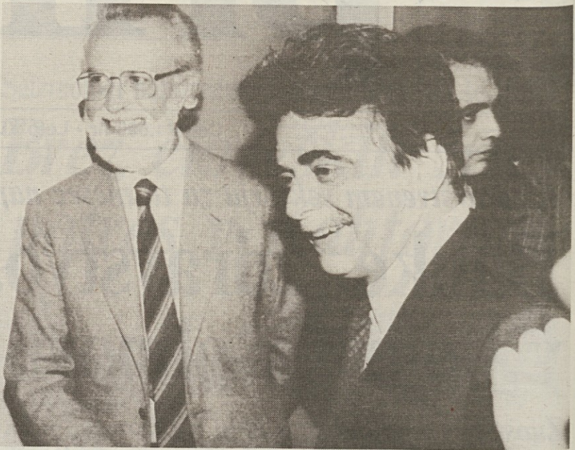
Na sedežu združenja tujega tiska v Rimu so včeraj predstavili knjigo Achille Occhettoja »Un indimenticabile 89« (Nepozabno 89.)