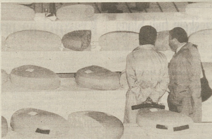
Pariz se je te dni ves predal kmetijstvu: od včeraj je namreč odprt sejem, na katerem razstavljajo 1.300 vrst sira, 10 tisoč različnih vrst vina, mesne izdelke in še marsikaj okusnega