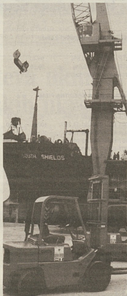
Delo v pristanišču v Bati z modernimi sredstvi, ki so sad sodelovanja s tržaškimi pristaniščem.

Mednarodno poslanstvo Trsta, o katerem se v zadnjem času toliko govori, lahko sega zelo daleč, če ga spremljamo podjetnost in strokovnost. Recimo do osrčja Afrike, do Ekvatorialne Gvineje, ene najmlajših in najmlajših afriških držav, kjer je Ustanova za tržaško pristanišče posodobila, opremila in zdaj tudi konkretno upravlja glavno pristanišče te države.