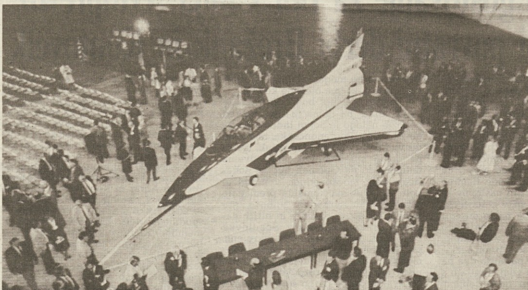
V Palmdalu v Kaliforniji so predstavili nov biser vojnega letalstva. Gre za letalo X-31, ki so ga s sofinanciranjem Pentagona in bomske vlade izdelali deloma v delavnicah Rockwell International, deloma pa pri zahodnonemškem Messerschmittu.