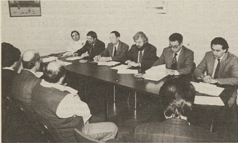
Z včerajšnjega srečanja na sedežu SDGZ