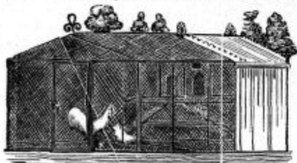
Trpežno! Hiša za 10 kokoš. Trpežno!

■ Pocijnena, bodeča žica (drat) iz jekla. ■