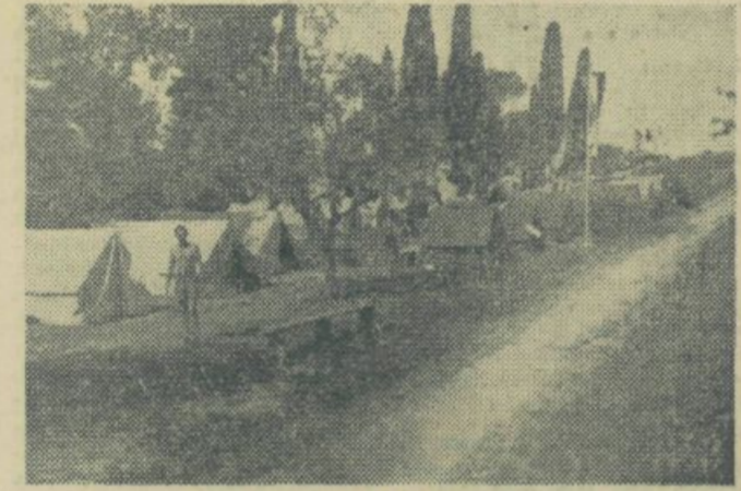
Taborišče v Ankaranu

lem letu, kakor tudi da spoznava vse aktualne probleme in da se na podlagi diskusij dajejo smernice za bodoče delo ter zbere material za univerzitetno skupščino ZSJ, kjer se bo o vseh teh vprašanjih podrobneje razpravljalo.