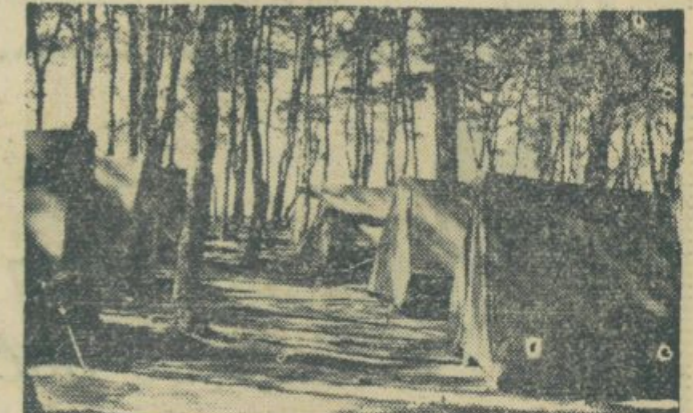
To je taborišče Puntamika pri Zadru, kjer so lelovali in študirali člani APZ

Na mehiški univerzi je bil letos poleti kongres študentk. Na kongresu so med drugim razpravljali tudi o tem, da naj študentke v večjem številu sodelujejo pri delu Mehiške študentske zveze. Študentska javnost je ta sklep kongresa toplo pozdravila.