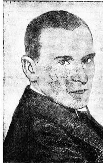
ALJECHIN znani šahovski mojster.

Razpis trafik. — Razpisane so sledeče trafike, za katere morajo reflektanti vložiti prošnje do označenih terminov: V Zerovnici št. 4 pri Ormožu do 9. junija.