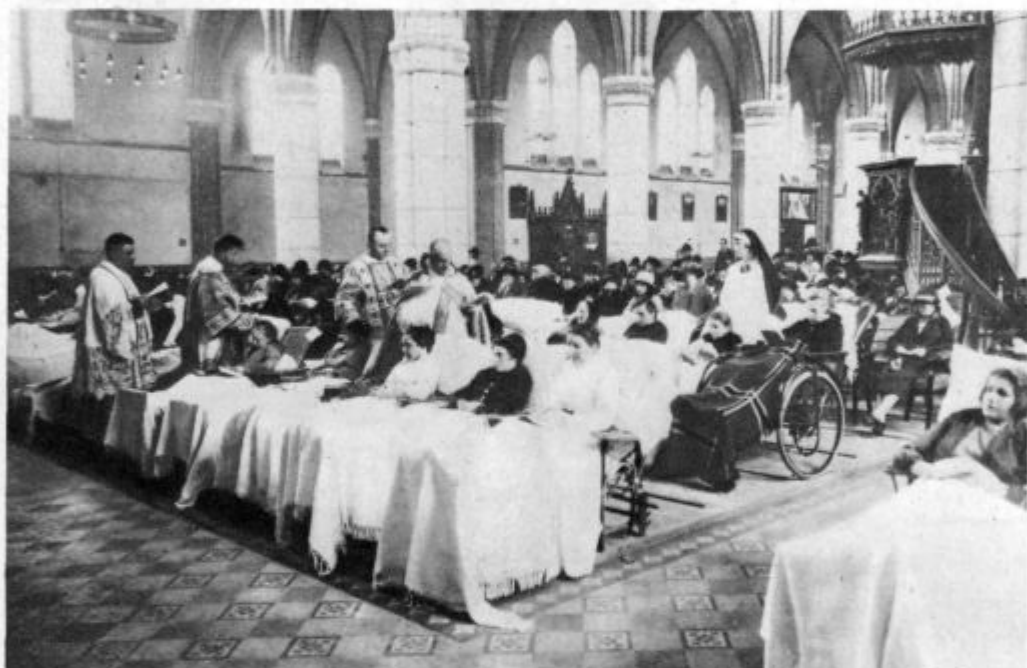
Misijon za bolnike v mestu Nijmegen na Holandskem.

se navzoči porazdele po vseh sobah v hiši. Najsvetejše spravim pod rjavo civilno obleko na prsih, grem ven in si prižgem smotéico. Stražnikom grem sam nasproti. Nagovore me in pravijo, da mora biti neke v hiši neki duhovnik, kj tu opravlja službo božjo. Ko sem ugovarjal proti nepoklicanemu vstopu, mi pokažejo pisмени ukaz in mi vele, da jih spremim. Prejskali so vso hišo, toda duhovnika seveda niso našli. Previdno so se nato postavili pri vhodu in čakali, dočim sem se jaz mirno odstranil. Ze 20 dni imajo povelje, da me zapro. Molite zame!« — Zadnji čas so došla poročila, da je Elija (Calles) postal