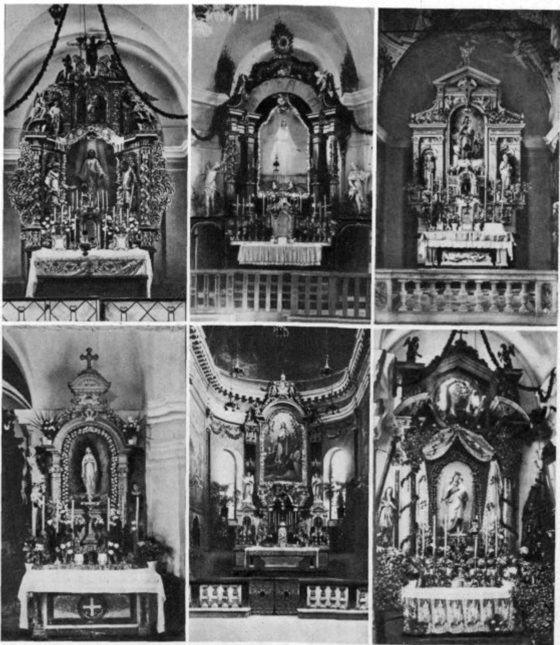
Šmarnični oltarji v župniji sv. Petra v Ljubljani.

Zgoraj: 1. Šmartno (sl. Ant. Koželj). 2. Sv. Kristof (H. Vurnik). 3. Stepanja vas (Jebačin). Spodaj: 4. Tomačevo (Jebačin). 5. Župna cerkev sv. Petra (Wolf-Jebačin). 6. Bizovik (Jebačin).