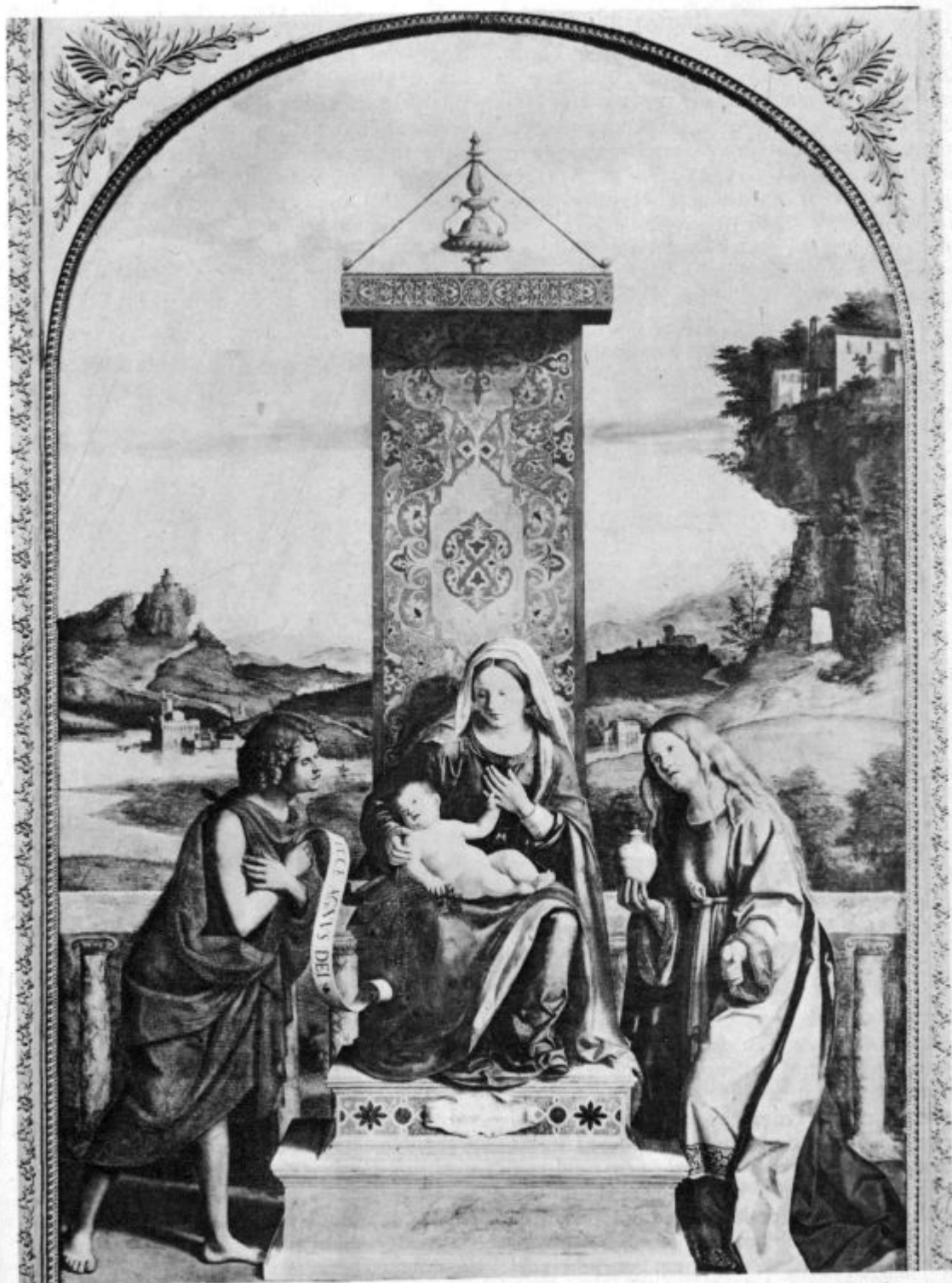
Cima da Conegliano.