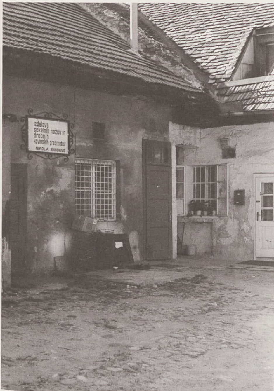
Obrtna delavnica na dvorišču Koroške 18 leta 1998

več obrtnih delavnic, nekaj se jih je ohranilo do nedavna, čeprav jih je na začetku 21. stoletja manj kot v preteklih dveh stoletjih. Kdor potrebuje storitve čevljarjev, nožarjev, kleparjev, fotografov, ključavničarjev in nekaterih drugih obrtnikov, mora še vedno stopiti skozi hišno vežo na katero od dvorišč. Gre seveda za najete lokale, pred drugo svetovno vojno pa so bili to lahko tudi obrtni lokali lastnika hiše. V tem primeru je bilo razmerje bistveno manj sporno, saj sta bila lastnik in obrtnik ista oseba ali pa sta bila v sorodu. Do sporov, ki so se občasno pojavljali, kadar je šlo za najemno razmerje, tako ni prihajalo.