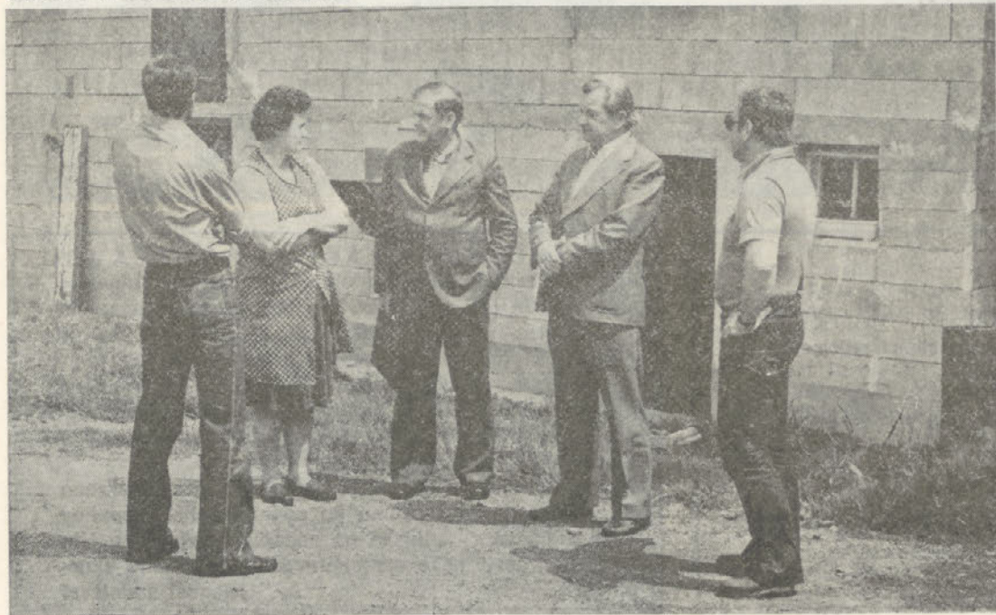
Posnetek z lanskega obiska pri kooperantih.