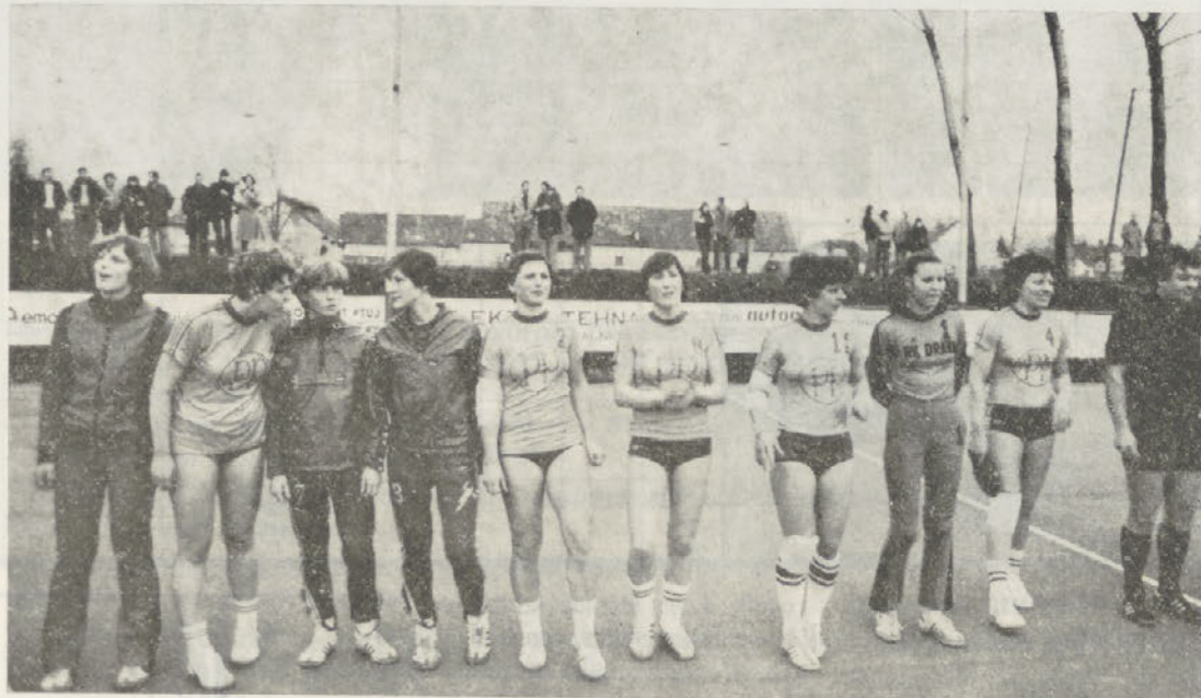
Rokometna ekipa PP Drava