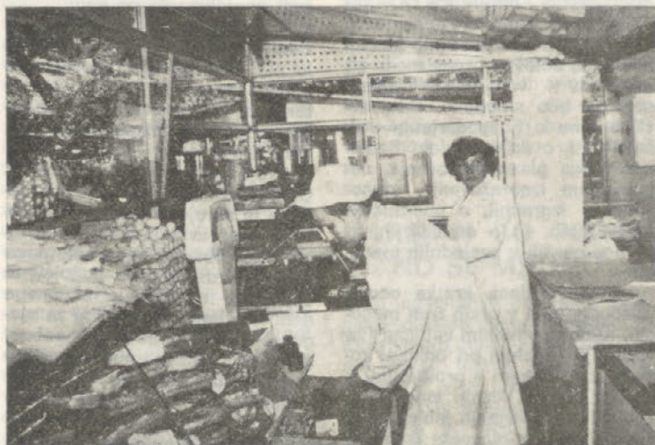
Prodaja blaga v kiosku v Beogradu

Odgovor bi najlažje dali naši komercialisti, ki pri prodaji naših proizvodov zaenkrat nimajo večjih težav. To pomeni, da smo marketinško usmerjeni in, da so imeli vodilni organi naše delovne organizacije v preteklosti dober občutek za prilagajanje proizvodnih programov dolgoročnim potrebam tržišča, čeprav se je marketing kot posebna znanost šele razvijal. Lahko bi rekli, da so proizvodnjo instinktivno marketinško usmerjali. Ob vedno večjih proizvodnih kapacitetah in ob zahtevnejših potrebah tržišča, pa je tudi v naši panogi vedno težje oceniti potrebe in pravilno usmeriti razvoj. Ravno sedaj so pred nami priprave srednjeročnik in dolgoročnih razvojnih programov. Izdelati bo potrebno nove koncepte razvoja in proizvodnjo usmeriti tako, da bo tudi čez pet, deset ali petnajst let mogoče brez težav prodati vse, kar bomo proizvajali. Dolgoročna ocena potreb postaja vedno težja, vedno zahtevnejša, saj se navade in želje potrošnikov ob stalnem dvigu standarda iz leta v leto spreminjajo, pa