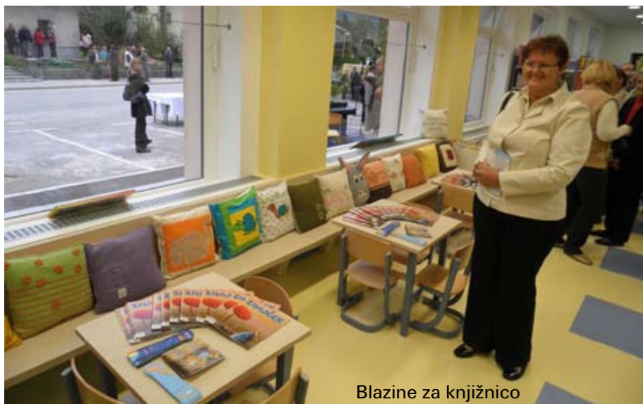
Blazine za knjižnico

V petek, 14.9., se je v Planinskem domu Moravče odvijalo srečanje društev, zasebnih zavodov in usta-