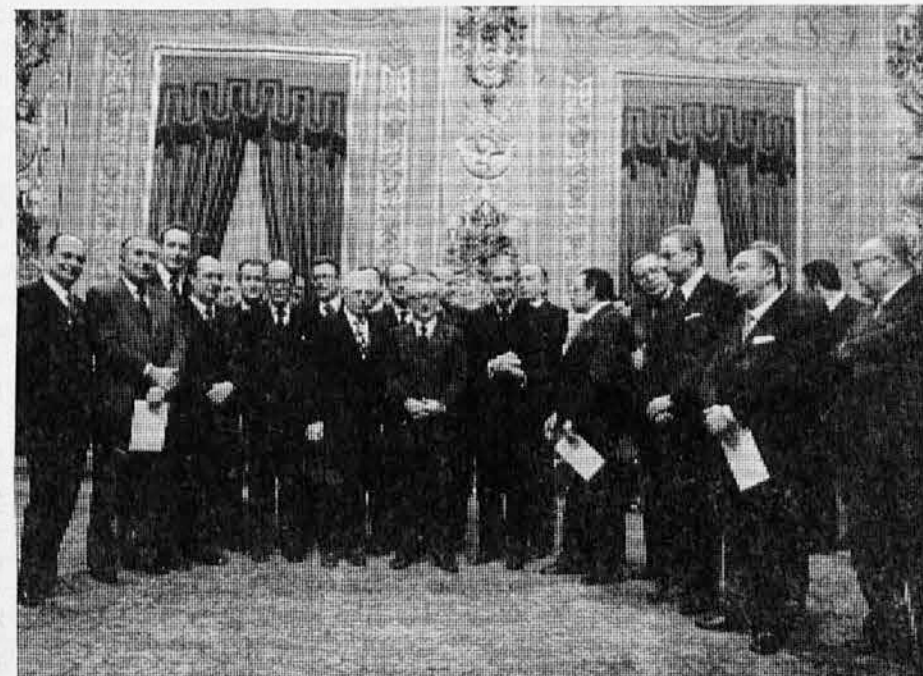
Nova Morova vlada, ki jo vidimo na sliki, je dvaintrideseta, odkar je Italija republika, deseta enobarvna in peta pod Morovim vodstvom. Sestavlja jo 22 ministrov in 39 ministrskih podtajnikov

Za sedaj je poglobljena naloga vlade, da mora sprejeti nujne ukrepe za izboljšanje gospodarskega položaja, ki se slabša iz dneva v dan. Tako je bila v ponedeljek 16. februarja vrednost lire v razmerju do USA dolarja 770, kar znači 12% razvednotenje, na črni borzi pa se je prodajal dolar za 880 lir.