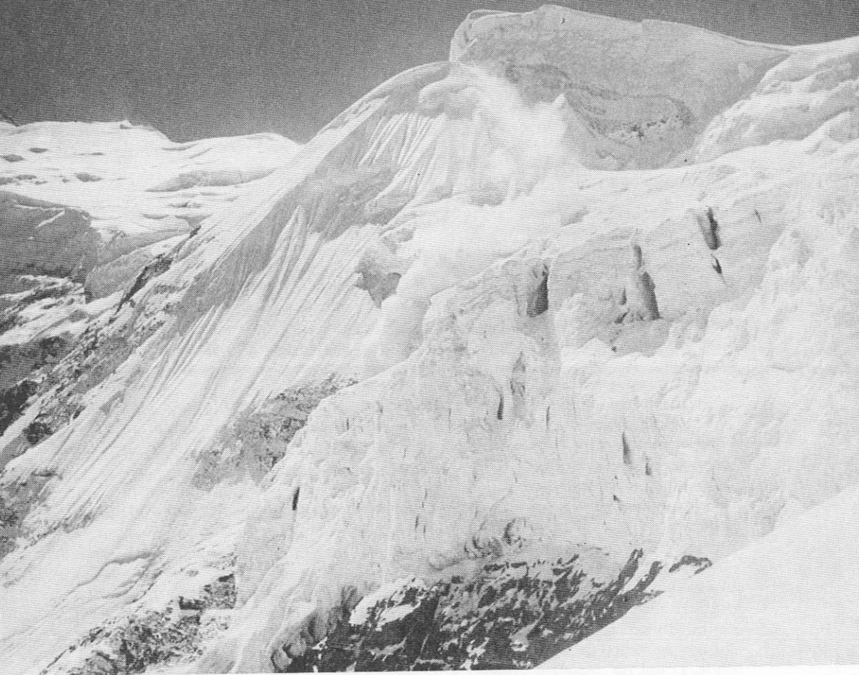
Ledni oklep Annapurne