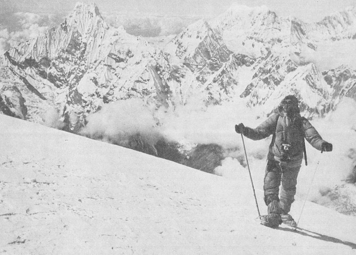
Levo zadaj Mačapučare