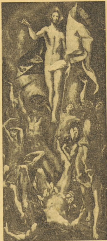
El Greco: Vstajenje

Če Gospod ni vstal, je prazna naša vera in prav tako prazna, če mi ne vstanemo z Njim...“