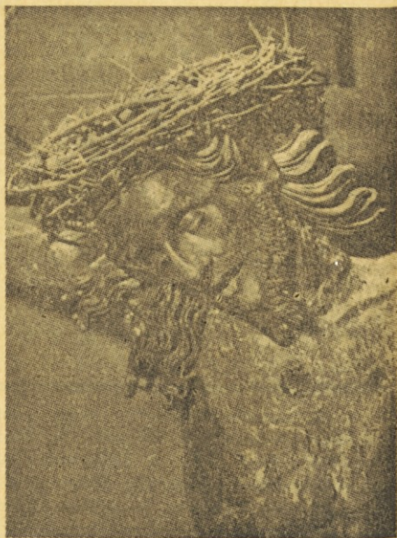
„Dopolnjeno je!“ — Križani v cerkvi sv. Damijana v mestu Assisi (Italija)

Morda bi ga „kulturonosec“ na mestu ustrelil. Vihtel je svojo puško, jo pritisnil ob lice, pa jo zopet povetil in