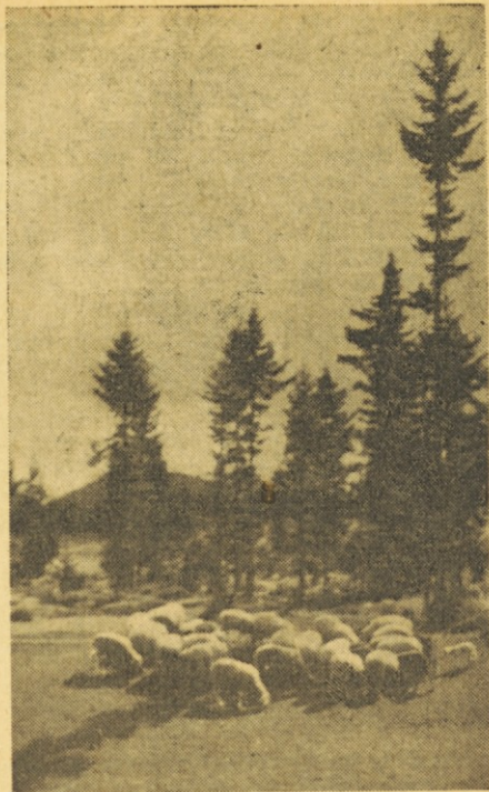
Pomladni motiv