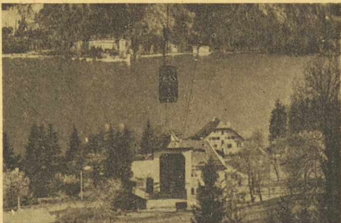
Osojsko jezero z nekdanjim benedik- skim samostanom in vzpenjačo na Osojščico (Gerlitz)

skušali pravilneje in razločneje govoriti, so se odslej med seboj kar lepo razumeli.