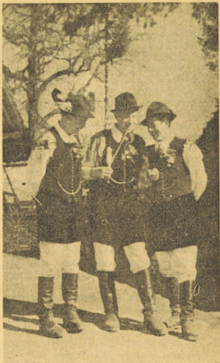
Pomeček po procesiji

Bomba v nadškofijski pa'či v Milanu. Dne 2. januarja t. l. zjutraj se je na okru nadškofijske palače v Milanu razpočila bomba, ki so jo tja položile nezne roké. Podrla je nekaj sten, en