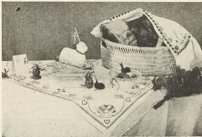
Levo: Velikonočni žegen (Foto V. Za- letel, Koroška)