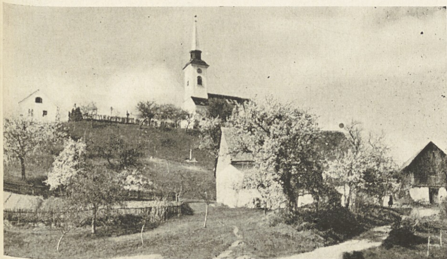
Na zadnji stra- ni: Cerkev sv. Marka v Vrbi