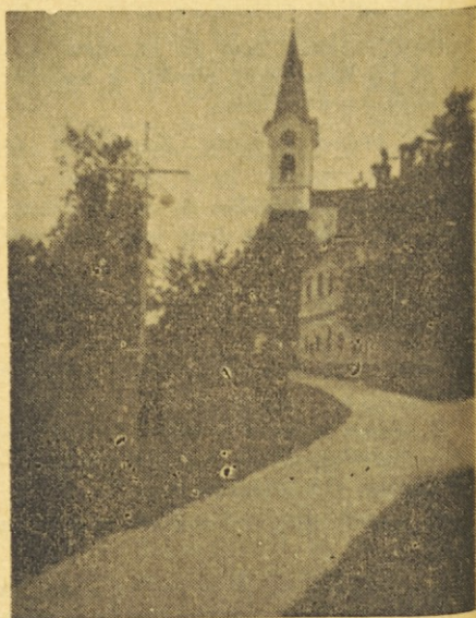
Župna cerkev v Predosljah, o kateri je govora v pričujočih spominih

Pa prav to nedeljo je hotel oče od mene vedeti, kaj so gospod kaplan pridigovali. Ob tem krutem vprašanju sem obnemel kot grešna duša pred božjo sodbo.