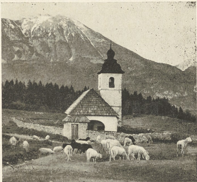
Spodaj: Sv. Ur- ban (595 m) pri Mariboru