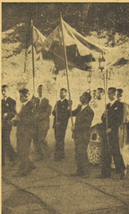
Procesija slovenskih izseljencev v Buenos Airesu

Bog je nedeljiv ali enovit. Svojstva, lastnosti ali popolnosti božje se od božjega bistva ne ločijo tako kot pri človeku, ki more bivati, če tudi ni dober, usmiljen, pravičen i. p. Božje popolnosti so istovetne z božjim bistvom. K božjemu bistvu spadajo vse možne popolnosti. Le naš omejeni razum razlikuje med eno in drugo božjo lastnostjo, ker spoznava Boga iz stvari, v katerih se nahajajo poedine različne popolnosti v omejeni meri. Bog pa je enovito, nedeljivo bitje, ki izključuje vsako sestavljenost in tudi možnost spajanja z drugim bitjem. Sv. pismo o Bogu ne pravi le, da je moder, dober itd., temveč da je ljubezen (1 Jan 4, 8), modrost (prim. Preg 1, 20), resnica in življenje (Jan