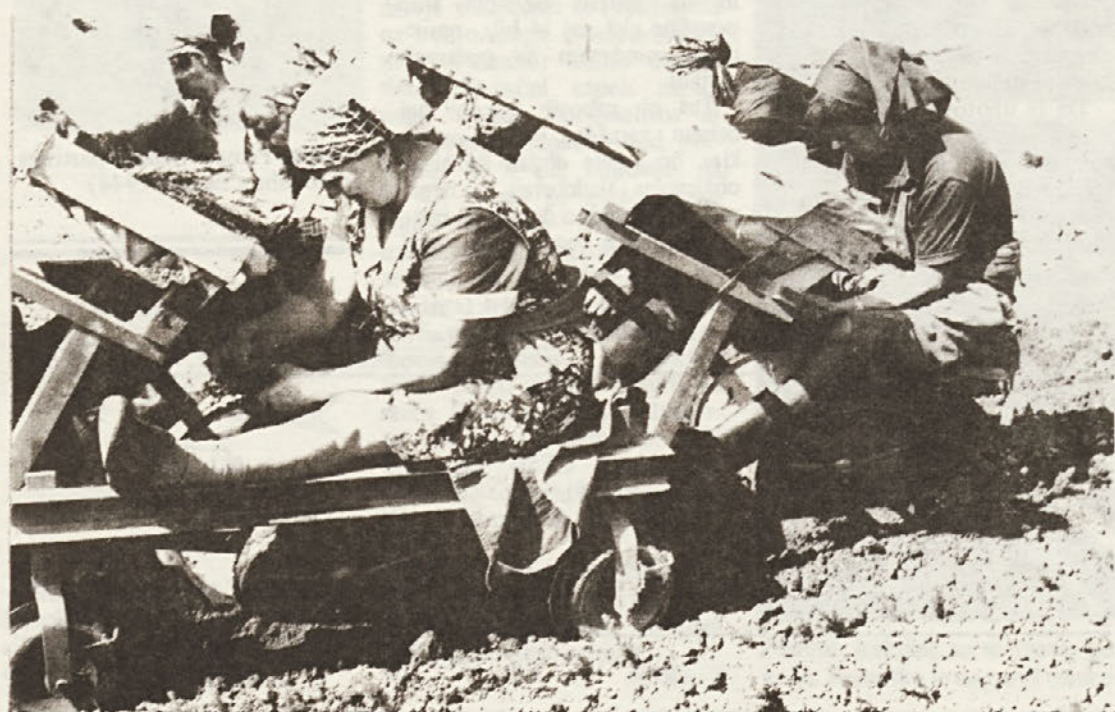
Priključek za presajanje sadik.