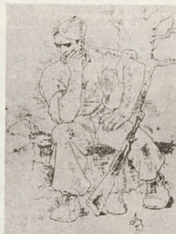
Nikolaj Pimat: Sedeči partizan (perorisba s tušem, 1944)

Pas ob robovih gozdov naj ostane zaraščen z grmovjem, kjer bo imela divjad možnost obžiranja. Vzdrževali in negovali bomo sadno drevje, ki raste v zapuščenih vaseh, ki so sedaj