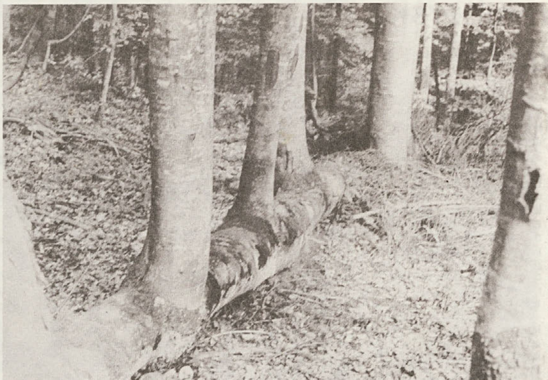
V odd. 25 revirja Resa, TOZD Črmošnjice, imajo svojevrstno zanimivost. Iz položenega, že pred dolgimi leti izrivanega bukovega drevesa, raste pet lepih ravnih debel. Redka in zanimiva stvaritev narave, ki jo moramo obvarovati pred poškodbami, kadar spravljamo ali sekamo v bližini.