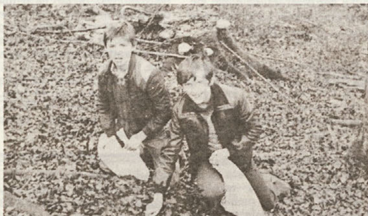
Zasluzek – dinar za šolo in priboljšek... Dva izmed topličkih učencev pri nabiranju bukovega žira.