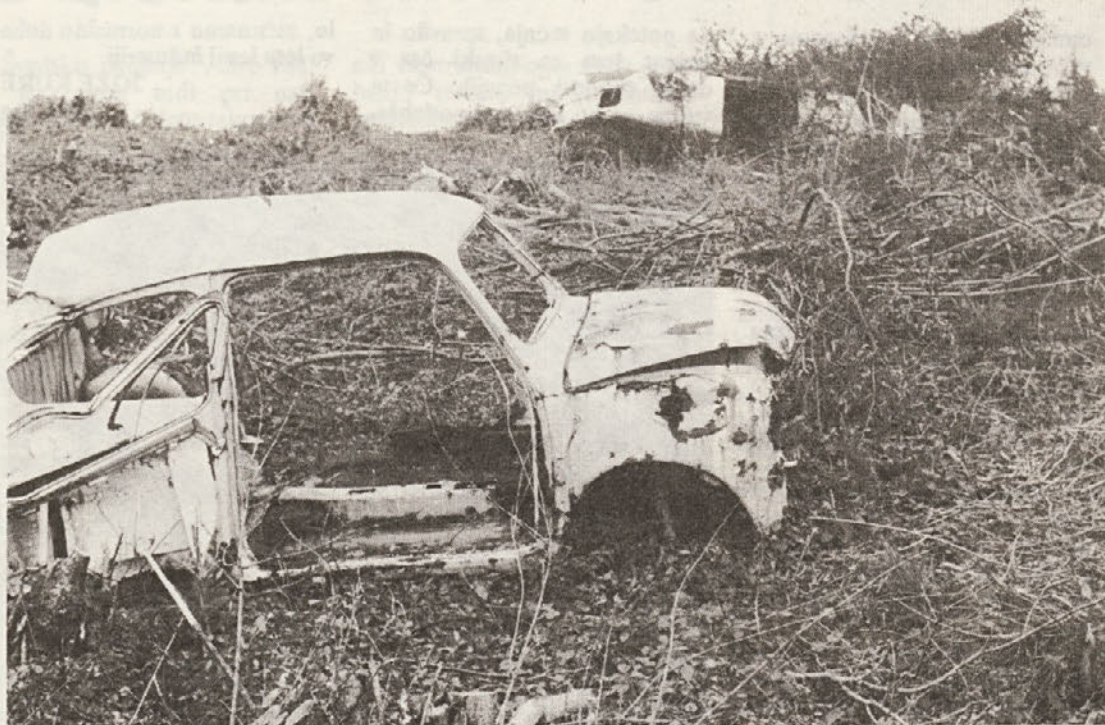
Proizvodnja v avtomobilski industriji skokovito narašča. Kako bo videti čez deset let, če bomo vse stare avtomobile odlagali v gozdu? Dokler sta bila ta dva vozna, sta prav gotovo kdaj napak parkirala in bila kaznovana. Sedaj sta našla mir v gozdu brez kazni ali vsaj opomina . . . (Foto J. Penca).