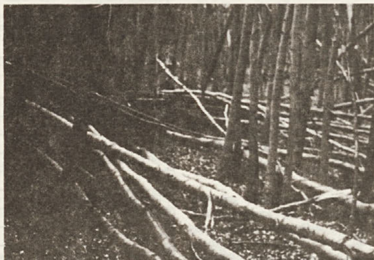
Podobe, kakršne so se kazale gozdarjem potem, ko je žled opravil svoje.