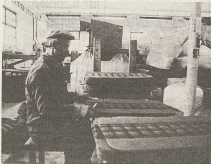
Tapetništvo ostaja na Mirni

Naj se spomnimo le poslednje neuspele variante, da naj bi na Mirni realizirali program IMV 2, kar je posebna strokovna komisija ocenila kot neustrezno lokacijo in postavila zahtevo, da se za to temeljno organizacijo izdela nov sanacijski program.