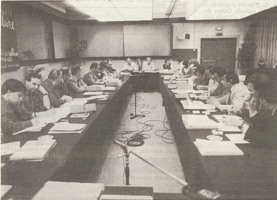
Delegati na evropski konferenci grupe Renault