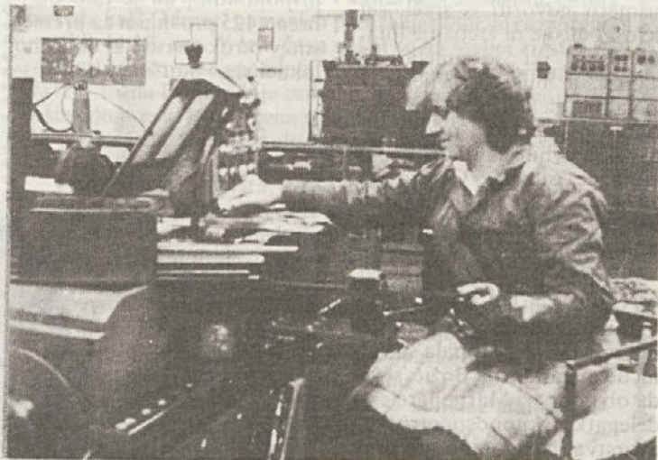
Lokacija na kateri je sedaj kovinski obrat je popolnoma neustrezna, sanacijski program predvideva izgradnjo novih proizvodnih prostorov, s površino 2500 m 2