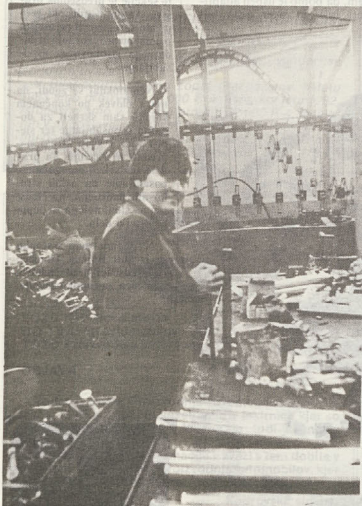
Kovinski obrat se lahko „pohvali“ s tudi več kot trideset let stari mi stroji.