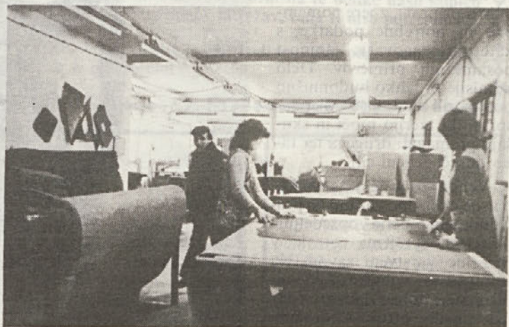
Kljub postopni opustitvi nekaterih programov, pa so za vse zaposlene našli delo v saniranih programih