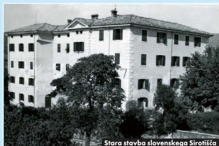
Stara stavba slovenskega Sirotišča

ni odhajati v italijanske zavode. Ko so ti otroci zavod zapustili, so bili tujci med lastnim ljudstvom in do tega največkrat sovražni.