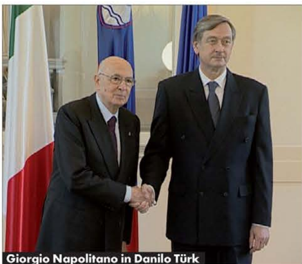
Giorgio Napolitano in Danilo Türk

ni v skladu z običajno prakso, temveč v nasprotju z njo. Da to ne drži, dokazujejo številni državniški obiski. Tudi ruski