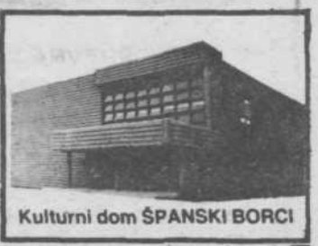
Kulturni dom ŠPANSKI BORCI