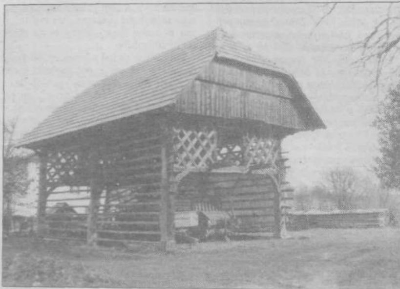
Lepo ohranjena kmečka arhitektura v Trebeljevem

Trebeljevo pa je v spisih Stiškega samostana (ustanovljen l. 1136) omenjeno že leta 1145 kot del njihove posesti. Po vsej verjetnosti so ga do-