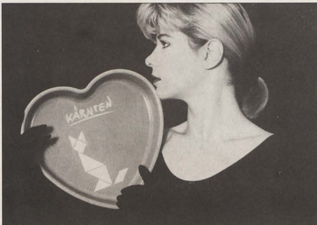
Novi, sedemdelni znak in beseda „Kärnten“ bosta odslej vabila na dopust na Koroškem.

Ravnatelji lahko dvojezična spričevala za ljudske šole naročijo pri „Naši knjigi“ v Celovcu, Pavličeva ulica 5-7.