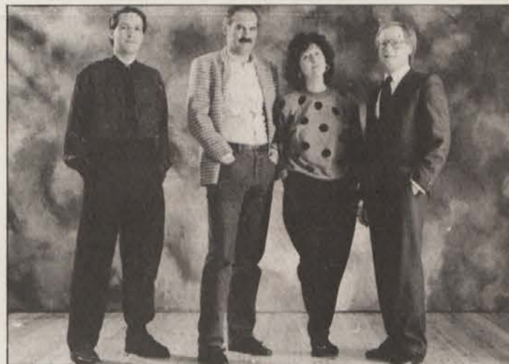
Skupina, ki je oblikovala novo propagandno linijo.