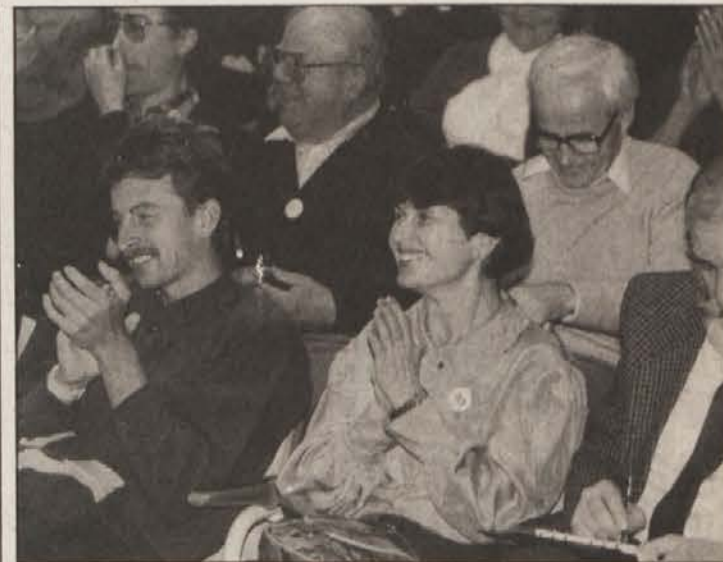
Obrazi udeležencev kongresa povedo vse: razpoloženje pred volitvami je sproščeno in optimistično.

V Beogradu se je v soboto začel izredni kongres Zveze komunistov Jugoslavije. Že na začetku so se pokazale velike razlike med srbsko in slovensko partijo. Gre predvsem za različne vizije bodoče jugoslovanske države in družbenopolitičnega sistema. O poteku in sklepih kongresa bomo obširneje poročali v prihodnjih številki.