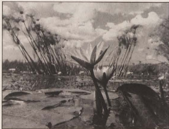
Rožnati morski teloh sodi med zaščitene rastline

To brezizjemno enosmernost ponazarja tudi misel iz gradiva Svetovnega sklada za varstvo narave (WWF): „... vozila, letala, satelite, ki jih je razdeljal človek, je zmeraj mogoče napraviti ponovno. Živega bitja, naj bo želva, slon ali samo preprost metulj, pa vsej naši znanosti navkljub ni več mogoče obnoviti!“