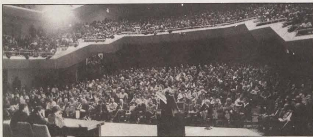
Ob predstavitvi programa in kandidatov združene opozicije „Demos“ je bila velika dvorana Cankarjevega doma v Ljubljani zasedena do zadnjega kotička.

Ist Smolle, über dessen Schicksal als Minderheitensprecher letztendlich der Bundeskongress der Grünen entscheiden wird, bereits aus dem Rennen?