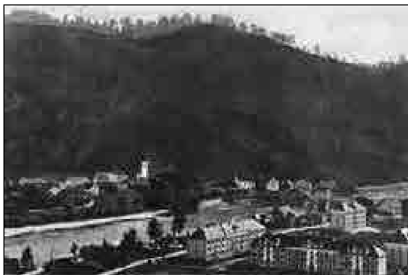
Pogled na Litijo – Gradec leta 1930. V ospredju delavsko naselje tekstilne tovarne.