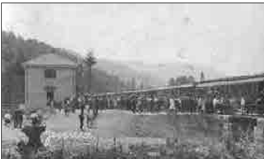
Odprtje železniške postaje Jevnica leta 1928 (Brilej, Spomin na Litijo str. 71 – objava z dovoljenjem avtorja).