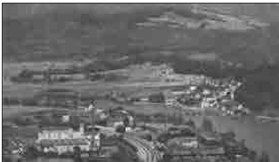
Razglednica Litije, poslana leta 1929. Spodaj je viden industrijski predel Litije ob železnici: levo predilnica, desno topilnica. Na desnem bregu Save, desno od mostu, je viden trški del Litije.

500 delavcev, se je število delavcev (podatki so za obe tovarni skupaj) do leta 1931 povečalo na 656, leta 1939 pa že na 1.052. 89