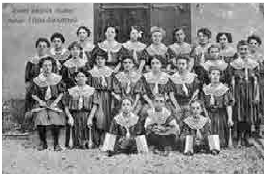
Litijske »sokolice« pred prvo svetovno vojno.