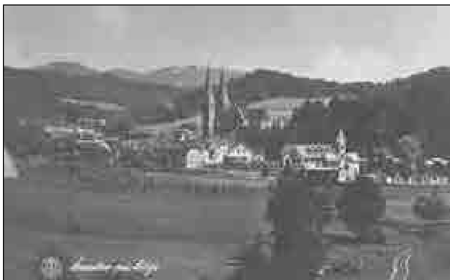
Šmartno pri Litiji leta 1940.

rastlinsko strojeno za galanterijo. 77 Leta 1934 je začela tudi Knafličeva tovarna usnja v Šmartnu pri Litiji s predelavo svinjskega usnja. Vendar so predelovali predvsem goveje kože, delno v podplatno usnje, delno v gornje usnje za obutev. 78