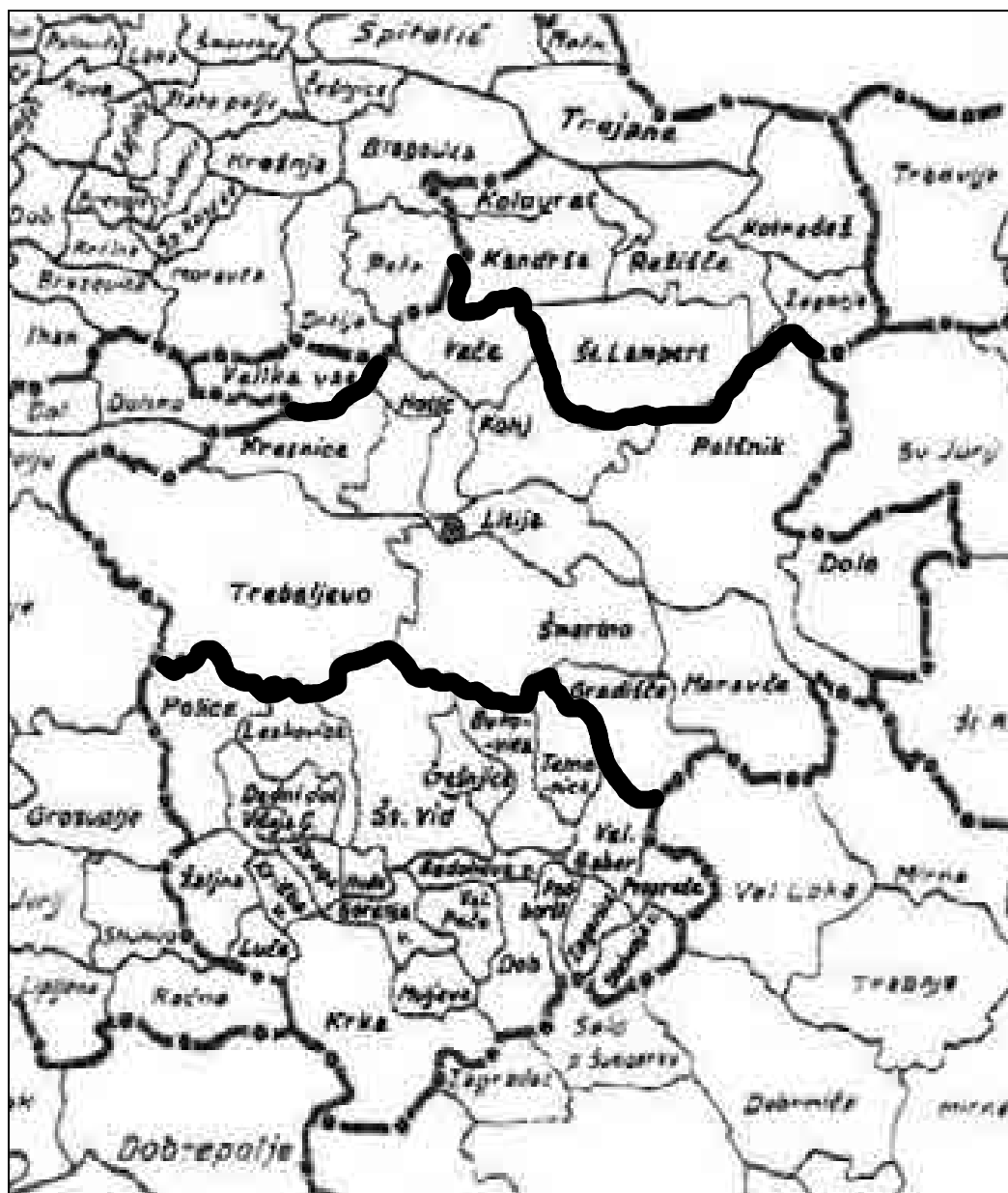
Okraj Litija leta 1928 pred komasacijo občin. Z debelejšo črto je označeno območje današnjih občin Litija in Šmartno pri Litiji (Ilustrirani Slovenec, št. 4, 22. 1. 1928, str. 29: Pregled krajevnih občin v ljubljanski oblasti).

tijšem okraju je načrt predvidel naslednje občine s katastrskimi oziroma davčnimi občinami (v oklepaju so pravilna imena krajev): 9