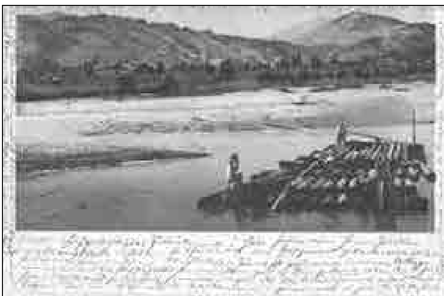
Flos na Savi leta 1900.

Sava je od izliva Ljubljanice še vedno veljala za plovno reko, čeprav se je promet po njej omejeval le na splavarstvo in posamezne brode, ki so prevažali ljudi z enega na drugi breg. Po Savi so prevažali predvsem posekan les. Hlode (več vagonov lesa) so na zbirališčih, ki so bila običajno nekdanje broderske postaje (Ribče, Sava, Renke), sestavili v večji splav. Obrezan les je šel dobro v promet do Zemunna, jamski pa do Zagorja, Trbovelj in Hrastnika. Splavarji so bili organizirani v zadrugah, poklic se je večinoma prenašal iz roda v rod. Ko so splav (flos) naredili, sta šla nanj ponavadi dva splavarja (flo-