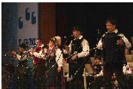
Po nekaj letih se je ponovno za Mengeško marelo zbrala odlična zasedba: Slovenski kvintet.