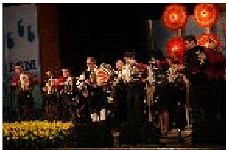
Klub harmonikarjev Stopar je pokazal, da tudi taka skupina lahko napravi pravo »štimgo«.