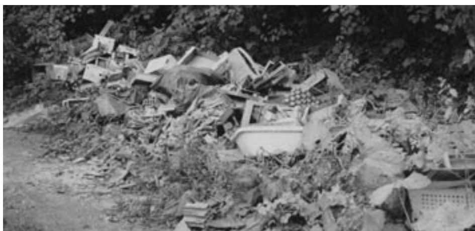
Divje odlagališče na Kolodvorski cesti v Mengšu