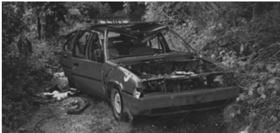
Zapuščeno vozilo – ne boste verjeli, tudi v Mengšu

Oddaja nevarnih gospodinjskih odpadkov bo v četrtek 31. MARCA med 17.00 – 19.00 uro na