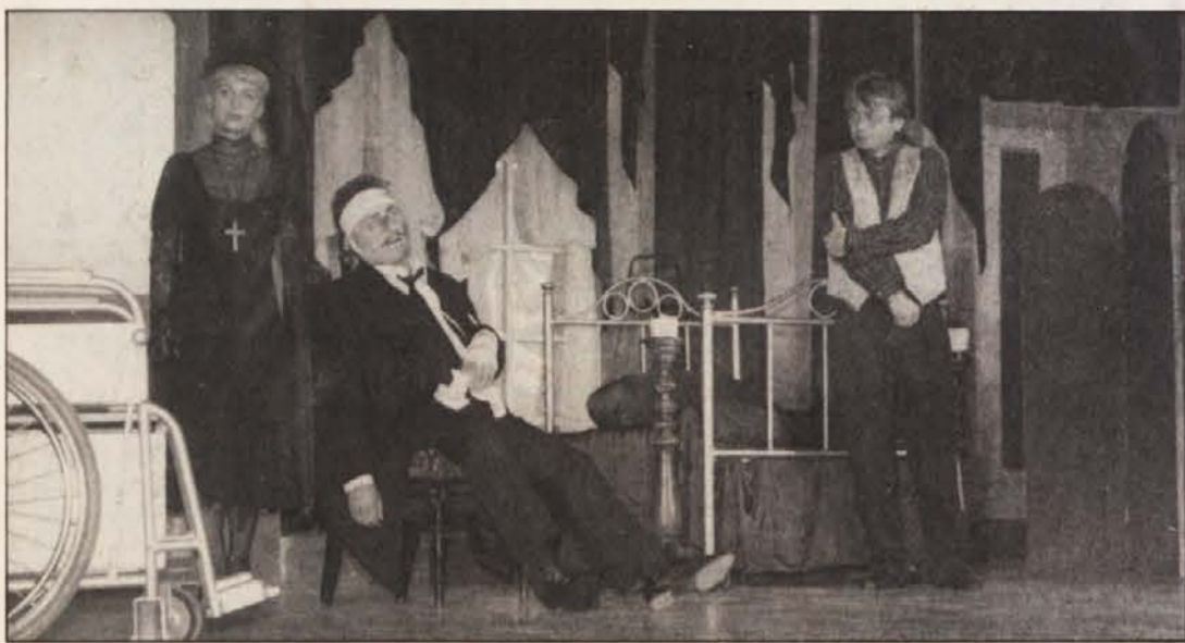
Prizor iz igre „Plen“, ki jo je uprizorilo SLG Celje.