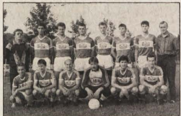
Tokrat so Selani podlegli, a še upajo.

Olip pa je kljub porazu še vedno optimist: „Če bomo prihodnji vikend zmagali v Borovljah, vlak v 1. razred še ni odpeljal.“