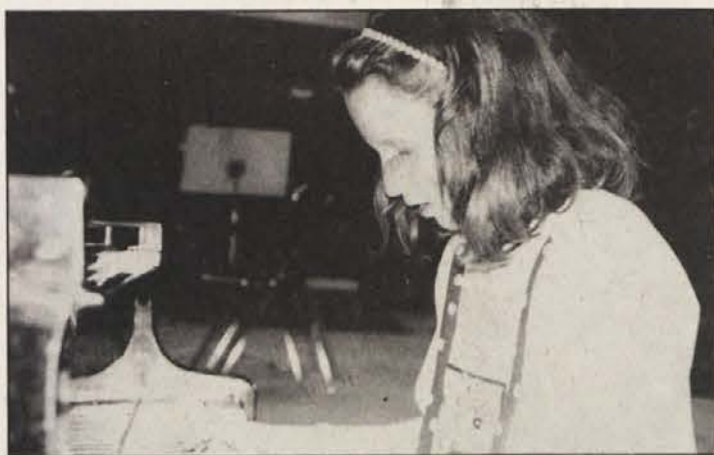
Največ učencev glasbene šole se uči klavir.

NEW YORK. – V torek je umrl Art Blakey, svetovno znani bobnar, ki si je ustvaril ime predvsem na področju jaza. Poleg Dizzy Gillespieja je sodil med redke izjeme veterana jaza, ki so nastopali tudi še v tej starosti. Blakey je zaslovel s svojo skupini „Jazz Messengers“, ki jo je ustanovil leta 1954 in iz katere je izšla vrsta mojstrov jaza.