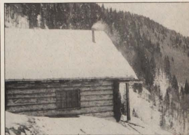
To pastirsko koč na Rožci (slika), last pašniške zadruge Sentjakob, je imelo nekaj let v najemu Slovensko planinsko društvo Celovec. To je bil prvi planinski dom po obnovi organiziranega slovenskega planinstva na Koroškem. Koče ni več, ker je pogorela. Sedaj je tam nova pastirska koč, ki jo imajo v najemu smučarji iz Vrbe.

BOROVLEJE. – Kar je za Dobro vas Jožefov sejem, je za mesto puškarjev Borovlje vsakoletni Martinov trg. Letos ga bodo priredili v ponedeljek, 5. novembra.