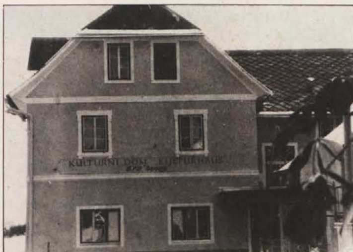
Pri Cingelcu na Trati bodo gostovala boroveljska društva.