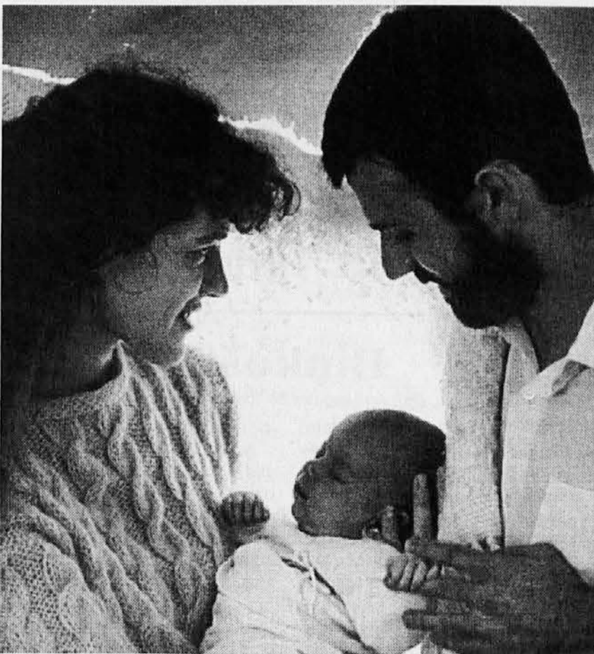
Papeški svet za družino je pretekli teden objavil poseben dokument o družini. Več o njem v članku na 2. strani