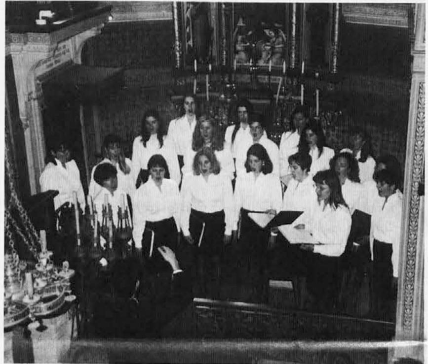
Dekliški zbor Vesna iz Križa pri Trstu