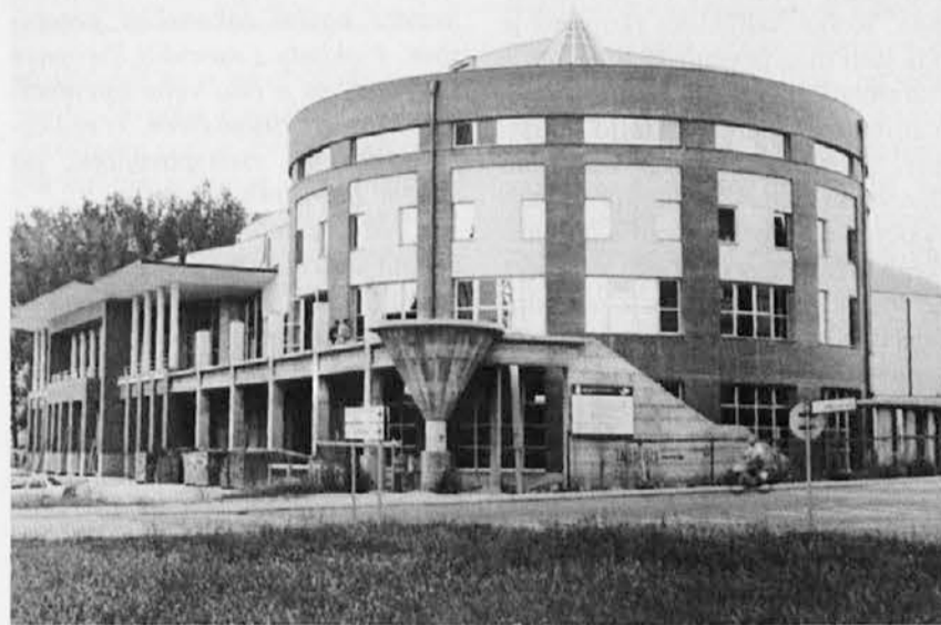
Novo poslopje Primorskega dramskega gledališča v Novi Gorici