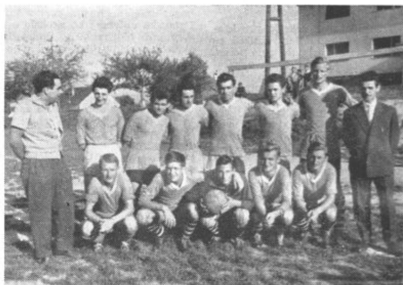
Ekipa, ki se je pomerila z »Jarenino«