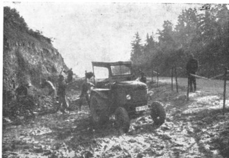
Klanec ob Črnem lesu bodo nekoliko znižali in cesto v tem delu napravili bolj pregledno. Na sliki: odkop zemlje v Črnem lesu