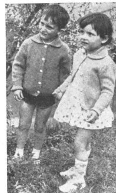
Pred nama je bodočnost

Med mnogimi jubileji slavimo letos tudi 20-letnico obstoja pionirske organizacije. Pionirji so s sodelovanjem med NOB dokazali, da se jim lahko zaupajo važne naloge. Po osvoboditvi so se pionirske organizacije začele snovati po šolah. Idejni voditelj pionirjev v tem času je bila mladinska organizacija, medtem ko so vsakodnevno skrb pionirjem posvečali prosvetni delavci. S tem so tudi bistveno vplivali na spremembe znotraj šole.