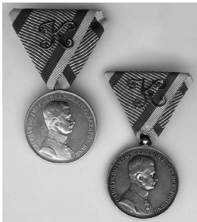
Zlata medalja za častnike