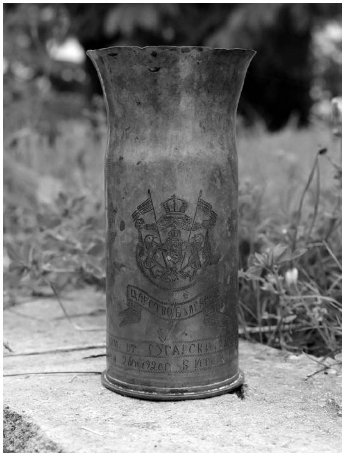
Granatni tulec, predelan v lično vazo