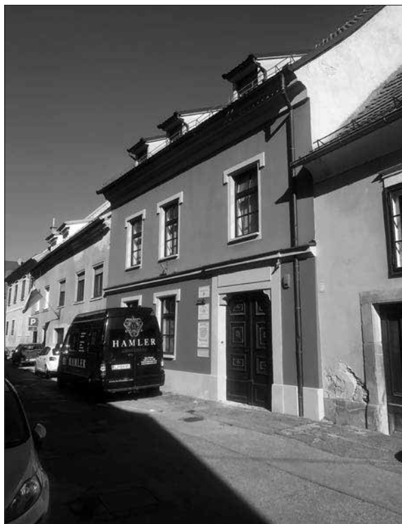
Približna lokacija nekdanje cerkve Vseh svetih, ki je v 16. stoletju služila tudi kot evangeličanski bogoslužni prostor. Jadranska ulica 9, Ptuj.

Prava mala ofenziva pisanj, ki pa ni prinesla uspeha. Deželni knez je ponovil, da v svojih mestih in trgih ne bo trpel druge veroizpovedi kot katoliške,