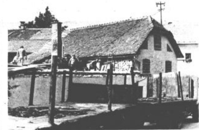
Sobota tako ali drugače