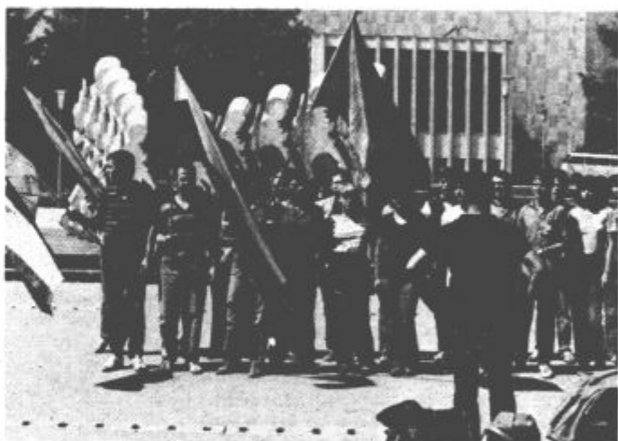
Zbor v Velenju pred odhodom na Golte