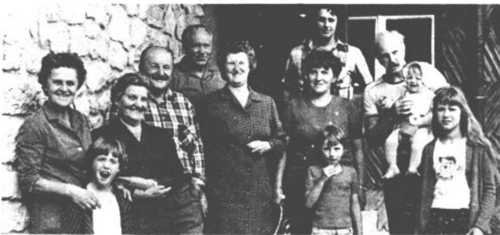
Skupina zadovoljnih dopustnikov v Mozirski koči zadnje dni julija