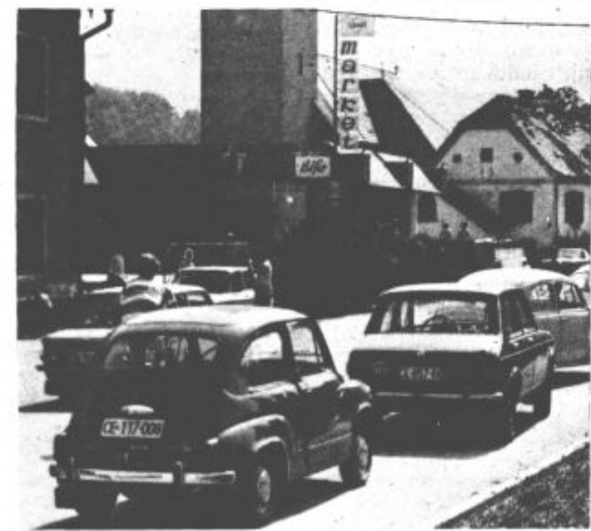
Zivahno je le pred trgovino (in bifejem)

In Zdenko Gračner: „Nisem iz Šmartnega, sem pa večkrat tukaj po najrazli-