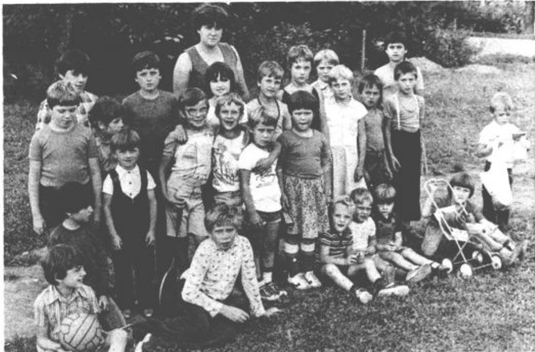
»Radi prihajamo v potujoči vrtec, ker je tukaj lepo, se igramo, srečamo se s prijatelji, gremo na sprehode. Doma pa nam bi bilo dolgčas,« so pripovedovali številni obiskovalci potujočega vrtca pretekli teden v Ložnici