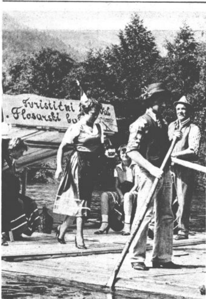
Ho — ruk in nasvidenje na 22. Flosarskem balu

Izvršni svet skupščine občine Velenje pa se je na 139. seji, ki je bila v ponedeljek, 3. avgusta, seznanil z zahtevami, ki jih je sprejel zbor združenega dela skupščine občine Velenje na zadnji seji — Posredovano pa je bilo, med drugim, tudi poročilo o uresničevanju akcijskega programa za združitev ozdov komunalnega in stanovanjskega gospodarstva v novo delovno organizacijo Vekos Velenje.