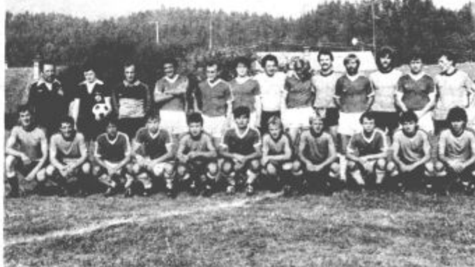
Tradicija nogometnih srečanj ob Flosarskem balu je obveljala, tokrat s srečanjem domačih in šmarskih nogometašev