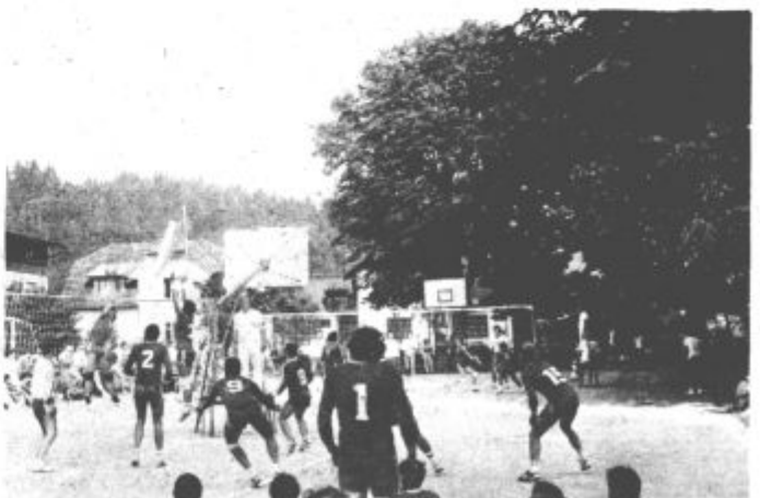
Odbojkarji in odbojkarice iz vse Slovenije so navdušili številne gledalce