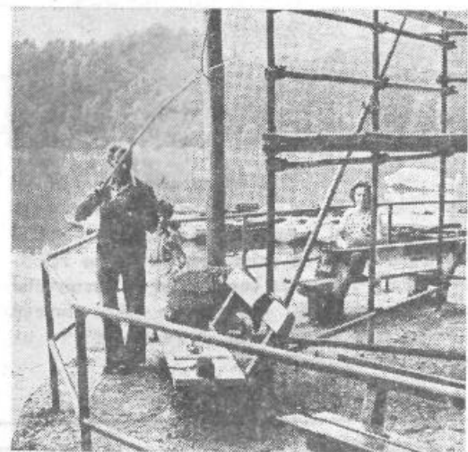
Ribiči pravijo, da je ulov dober