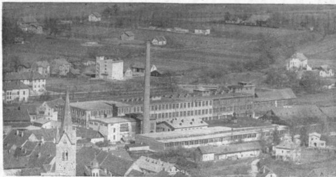
Slov. Konjice — v ospredju usnjarski kombinat Konus z novozgrajenim obratom za umetno usnje

Toda zgodilo se je, da je tudi ta kritik sam nabavil osební avto. Razumljivo, da mora biti za vožnjo potreben šoferjski izpit, ker žele ta ti daje dokaz in pravico, da lahko prideš na cesto z avtomobilom. Možakar je to vse napravil in sedaj že nekaj časa kar dobro vozi po cesti. Toda s tem ko je postal motoriziran, ko torej za prehod iz krova v kraj ne uporablja več svojih nog, temveč avto, pa se je spremenilo tudi njegovo mnenje!