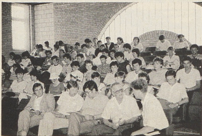
Mladi delavci sozda Gorenje so se v Vranju sestali na programski konferenci.

Namen srečanja je bil oceniti enoletno delo mladinskih organizacij v sozdu Gorenje, o čemer bomo poročali v naslednjem Informatatorju.