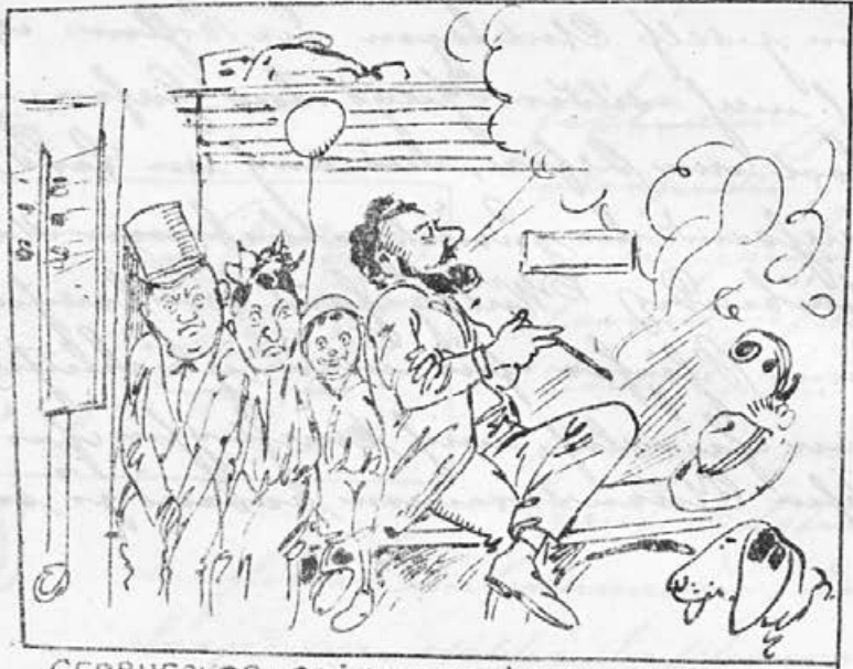
GEDRUECKTE · STIMMUNG · IM · EISENBAHN- WAGEN.