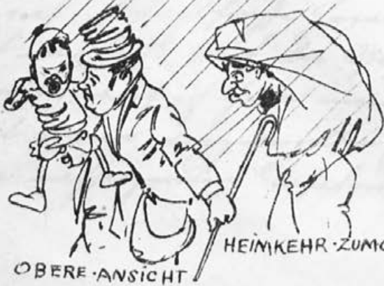
OBERE · ANSICHT