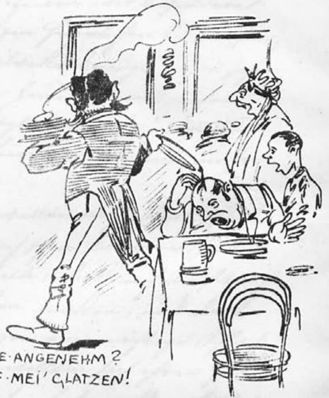
BITTE · NOCH · SAUCE · ANGENEHM ? JA, ABER · NÖT · AUF · MEI' · CLATZEN!