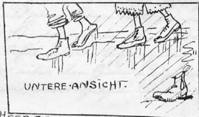
UNTERE · ANSICHT.