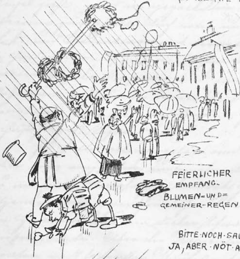
FEIERLICHER EMPFANG. BLUMEN-UND- GEMEINER-REGEN