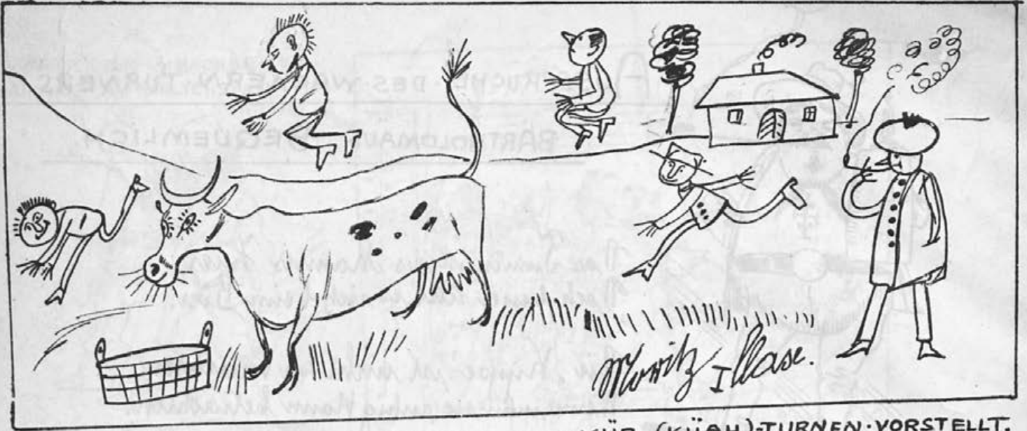
WIE SICH DER KLEINE MORITZ DAS KÜR-(KÜAH)-TURNEN VORSTELLT.