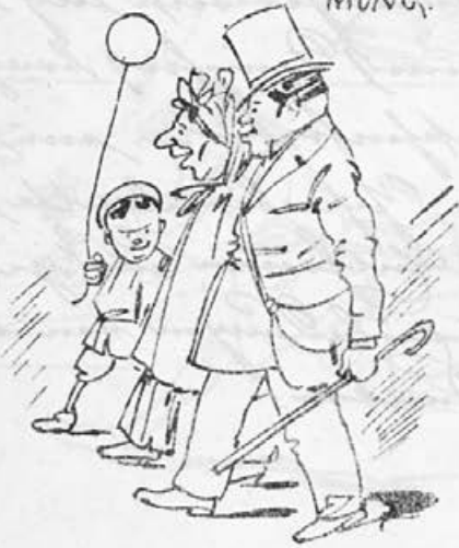
ABMARSCH · ZUM · LAIBACHER · SÜD- BAHNHOF · IN · FRÖHLICHER · STIM- MUNG.