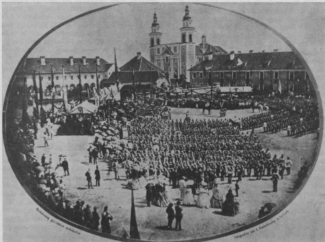
1. Blagoslovitev polkovne zastave pred šentpetersko vojašnico v Ljubljani — fotografija iz leta 1865

Bržkone v sredi 60 let, prav gotovo pa ne po letu 1868 je nastala druga fotografija. 4 Prikazuje nam skupino avstrijskih oficirjev različnih rodov vojske, med njimi največ pripadnikov pehotnih in lovskih enot. Kakor