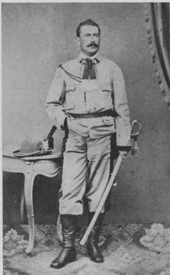
3. Oficir prostovoljnega alpskega korpusa — ljubljanska fotografija iz leta 1866

avstrijskem ekspedicijskem korpusu 1864 na strani cesarja Maksimilijana.