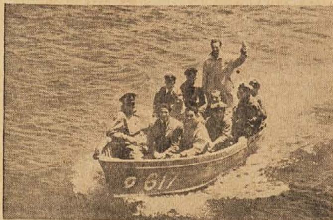
Jugoslovanska posadka se vrača v svojo bazo