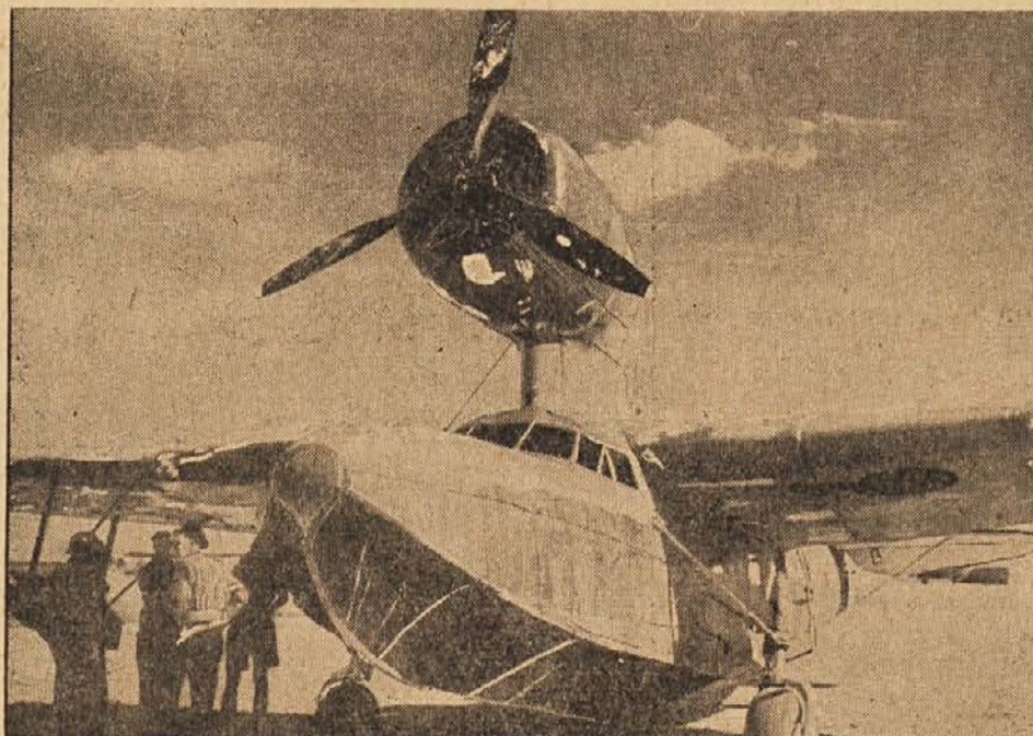
Jugoslovansko vodno letalo tipe "Fairchild"