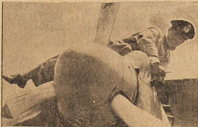
Juhoslovanski pilot popravlja svoje letalo