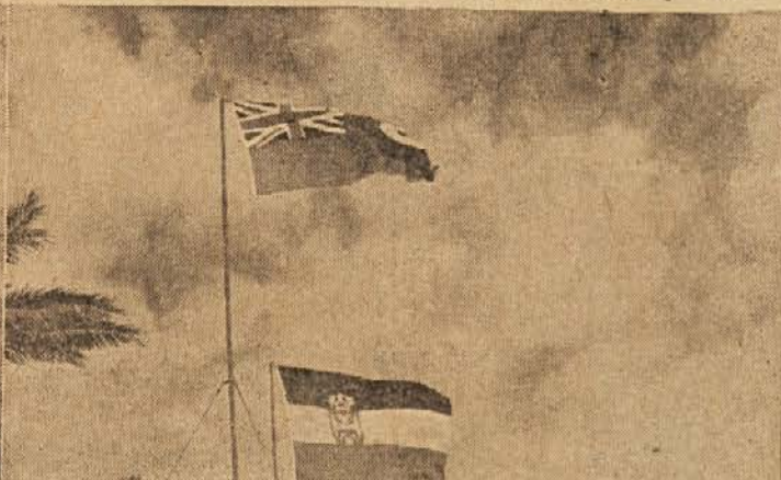
V bratski slogi plapolata britanska in jugoslovanska zastava nekje na Srednjem vzhodu