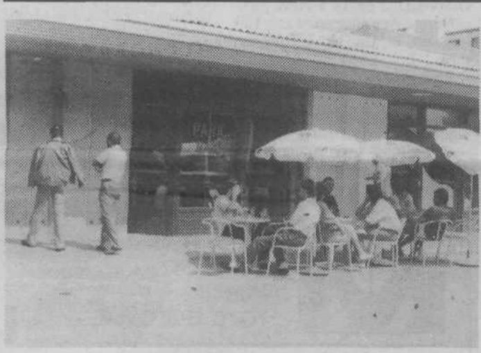
Ko bodo uredili tudi preostale lokale, ko ne bo več gradbišč, bo postalo to živahno in nadvse prijetno središče domačinov

V še razmeroma novi soseski Nove Jarše se dolgo ni nič zgodilo, kar bi vneslo vsaj nekaj pestrosti v monotonost spalne soseske. Sedaj, ko so v KS Dušan Kveder-Tomaž le zgradili servisni center, pa bo nekaj več družabnosti in udobja tudi tod. Konec avgusta je bil v tej novi »zlata vredni« (kot pravijo Jaršani) servisni stavbi odprt prvi gostinski lokalček in sicer Okrepčevalnica PARK BAR.