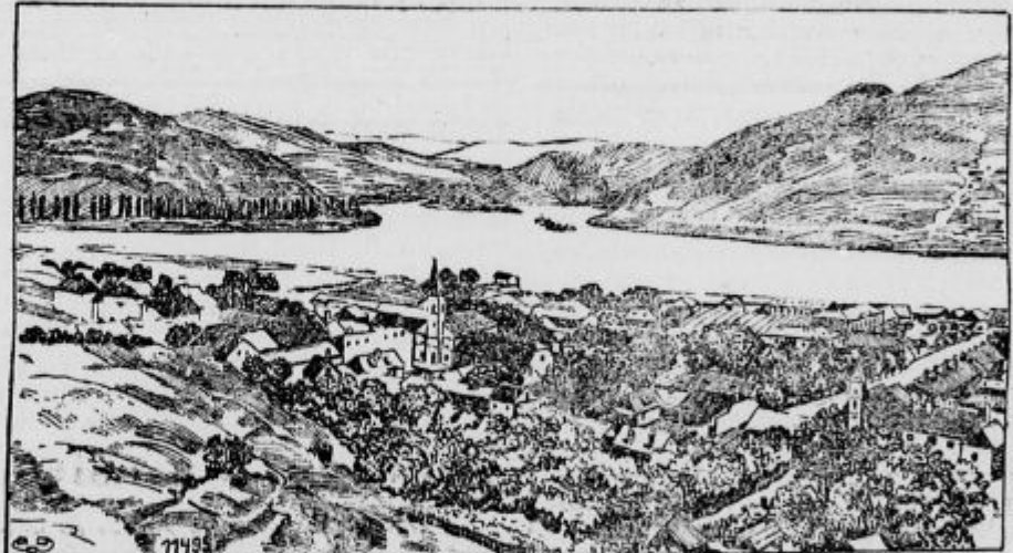
Pogled na Orșovo.

Na sedmograškem se bijejo težki gorski boji po zasneženih mejnih prelazih in gorah. Romuni se polagoma umikajo; njih čete silno trpe v karpatski zimi, ker niso vajene gorovja ne mraza.