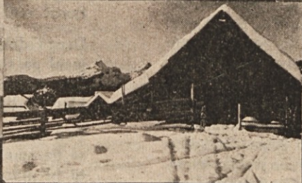
Poljuka Planina Favornik