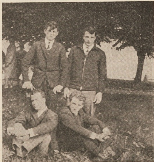
Slovenski smo fantje iz Loireta doma... (Sliko vam pošiljajo iz Francije)

Marseille. — Kako si človek zaželi nekaj domačega za praznik, posebej še božje domače-