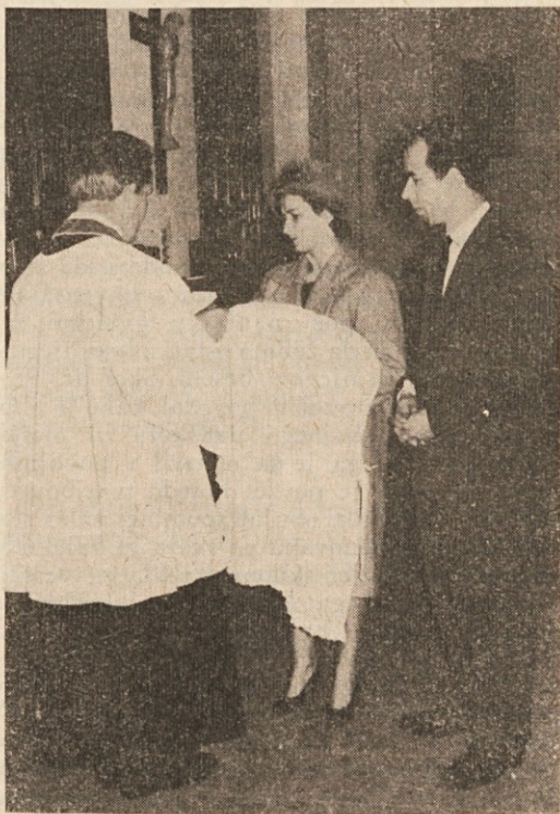
Krst Fride Marije Selak v župnijski cerkvi v Göteborgu na Švedskem.

Izseljenski duhovnik ni zato, da bi se z avtom okrog prevažal in si kraje ogledoval, jih že