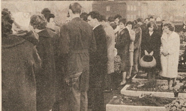
Slovenci v Nemčiji (Obh.-Sterkrade) so za praznik Vseh svetnikov obiskali grobove svojih rojakov, ki počivajo na tujih tleh.