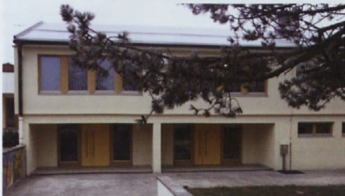
Nova energetsko varčna lesena okna na osnovni šoli v Markovcih, ki stoji ob novem lesenem vrtcu, bodo tudi šolarjem ponudila zdravo bivalno klimo.

Druga polovica leta je bila za nas delavna tudi na področju energetske sanacije oken in vhodnih vrat na šolah in vrtcih po Sloveniji. Na voljo so bila evropska sredstva, zato so se številne javne ustanove odločile za izvedbo delne sanacije oken ali celovite sanacije objekta. Zaradi velikega števila poslov, ki smo jih uspeli pridobiti, so se nekatera dela zavlekla. Vse šole in vrtci so večino del želeli imeti opravljenih med šolskimi počitnicami ali v času, ko otrok ni v objektih, tako da smo bile vse naše montažne ekipe polno zasedene po različnih lokacijah, odločilna je bila tudi učinkovita proizvodnja in dobra koordinacija projektov.