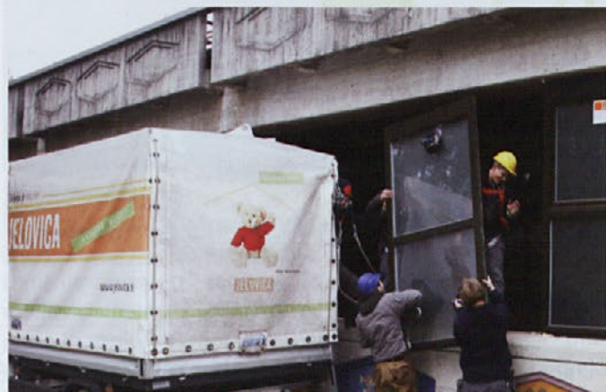
Na osnovni šoli v Radovljici so bili z izvedbo prenove oken in vhodnih vrat zadovoljni že lani, zato so se tudi letos odločili za Jelovico. Šola je tako postala odličen primer dobre energetske prenove javnega objekta.