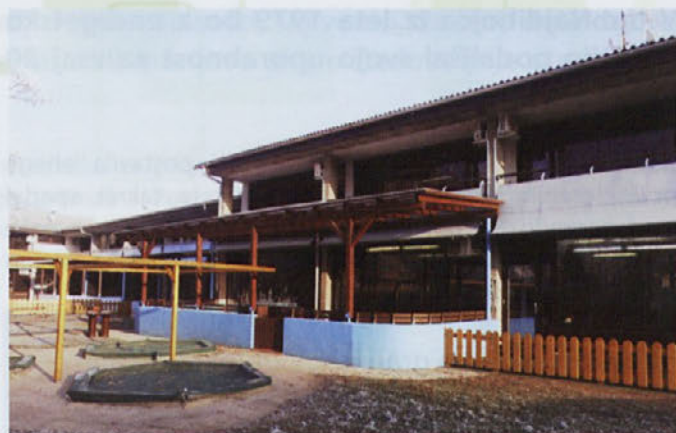
V kranjskih vrtcih so izbrali lesena okna s trojno zasteklitvijo, ki zagotavljajo nižje stroške ogrevanja.