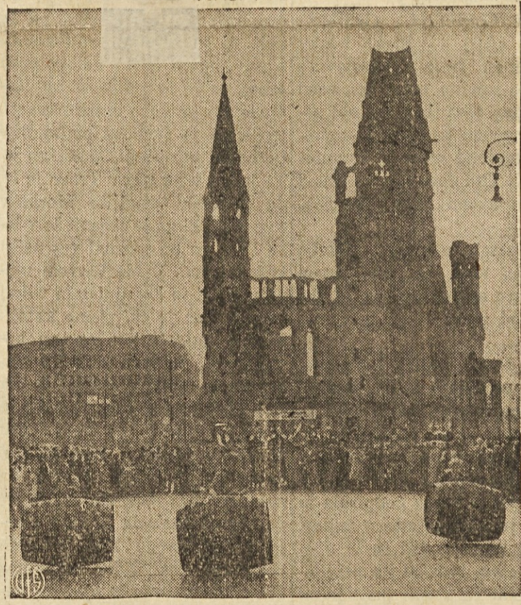
SODE VALE — Berlinski razvažalci in raznašalci piva so se nedavno pomerili v tem, kdo zna hitrejšo in spretnjejšo valiti sod. Tekma se je vršila v britanskem sektorju mesta. Kljub temu, da je Berlin sredi sovjetske zone Nemčije, njegovi prebivalci niso izgubili smisla za humor.

Podalšanje podmornice PHILADELPHIA. — Tukaj so podaljšali 311 čevljev dolgo podmornico U. S. S. Raton za 30 čevljev.