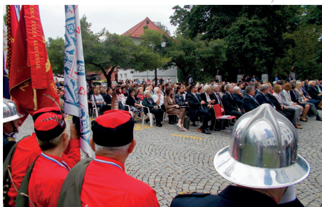
Slavnost je potekala pred ormoškimi gradom v prisotnosti nekaj sto udeležencev.

7. septembra 2019 sta Občina Ormož in muzej pripravila slavnostno akademijo ob 150. obletnici osmega tabora v Ormožu (1869–2019) . Slavnostni govornik je bil predsednik Republike Slovenije Borut Pahor, ki je bil tudi pokrovitelj dogodka. 15