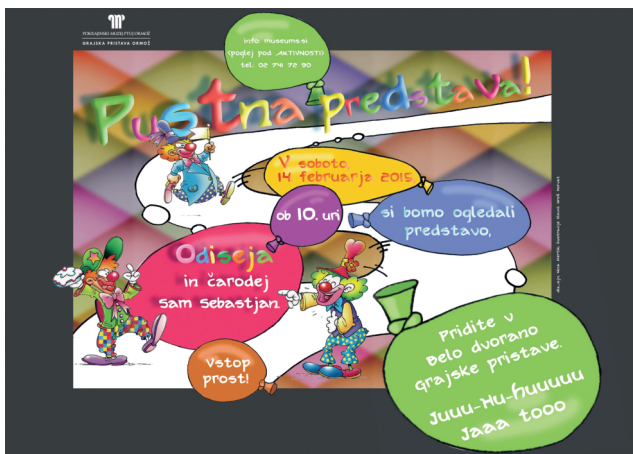
Vabilo na predstavo.

Za zabavo otrok je bilo poskrbljeno tudi s pustnim grajskim kinom 2. marca 2019. Kino je bil namenjen predvsem najmlajšim obiskovalcem, ki so se zabavali ob ogledu filma in različnih igrarh, nato pa so lahko tudi zaplesali v maskah.