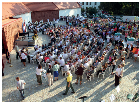
Svečanosti ob odprtju se je udeležila množica obiskovalcev.