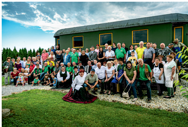
Udeleženci prireditve v Osluševcih.

Društvo za ohranjanje dediščine Prleški železničar je v sodelovanju z muzejsko enoto Ormož 11. junija 2021 s predstavitvijo zbornika Pogled na zgodovino železnice Prlekije in Prekmurja na prelomu modernizacije počastilo 160. obletnico odprtja proge Pragersko–Ptuj–Ormož–Čakovec–Velika Kaniža . Društvo je že leta 2016 pripravilo simpozij, letos pa je bil predstavljen širši javnosti zbornik referatov simpozija, za katerega so zaslužni avtorji referatov, sicer odlični poznavalci železniške dediščine, hkrati pa tudi pisci mnogih drugih strokovnih prispevkov. Objavljenih je bilo sedemnajst strokovnih prispevkov.