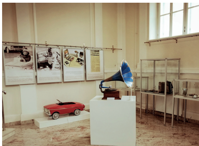
Pogled na razstavo.