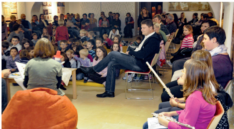
Pravljična urica z otroki.

7. novembra 2012 so se nam otroci in starši pridružili na pravljичni urici in muzejski delavnici Z nami po skriti zaklad . Sodelavki iz knjižnice Ormož Leonida in Nina sta najprej otrokom prebrali pravljico Tina in Tine, nato je sledila ustvarjalna delavnica, kjer so lahko otroci pokazali svoje spretnosti v izdelovanju različnih prazničnih dekoracij. Ob koncu dogodka so nanje čakala tudi darila; izvedli smo srečelov, v katerem je lahko vsak dobil zanimivo knjigo ali igračo.