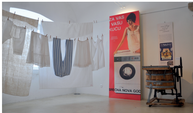
Pogled na razstavo.

18. maja 2016 je potekala slavnostna prireditev ob mednarodnem muzejskem dnevu. V muzejski enoti smo pripravili dva dogodka. Obiskovalcem smo predstavili sliko Žalostne Matere Božje , ki je bila preseljena iz ukinjenega ormoškega samostana v frančiškansko samostansko cerkev v Varaždin, v nadaljevanju večera pa je bila predstavitev glasbenega avtomata, ki ga je muzeju podaril ptujski zasebni zbiratelj Marko Sluga. 7