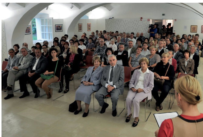
Odprtje razstave.

3. decembra 2012 smo obiskovalcem omogočili brezplačen ogled razstav in pripravili odprtje razstave Tapiserij slikarja in grafika Marija Preglja ter predstavili Vodnik po muzejskih razstavah v Grajski pristavi Ormož, gradu Ormož in gradu Velika Nedelja .