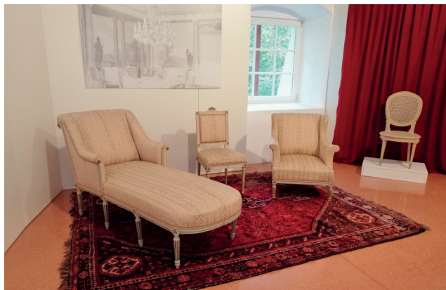
Ohranjeni pohištveni kosi iz ormoškega gradu. Hrani: Pokrajinski muzej Ptuj – Ormož.

Razstava Pisani svet pupik (odprtje 13. marca 2021) predstavlja punčke, igrače mnogih generacij otrok preteklega stoletja, ki so se do danes zelo spremenile. Sprva so bile izdelane iz cunj in bile predvsem igračke deklic. Marsikateri je tako preprosto izdelana punčka iz ostankov blaga predstavljala edino igračo, zato je nanjo še posebej skrbno pazila. Najstarejša na razstavi predstavljena punčka je izdelana iz porcelana in stara okoli sto let. 11