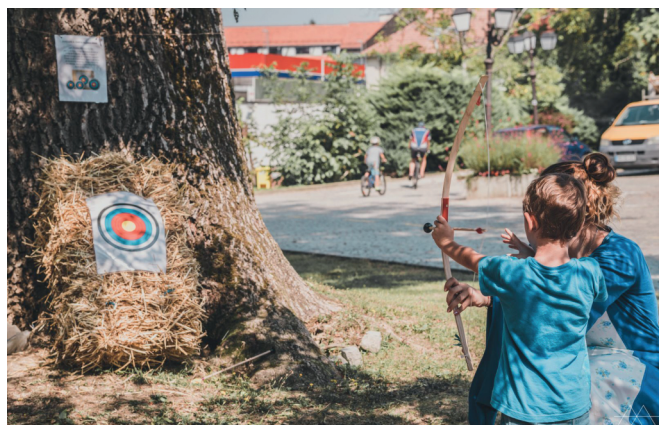
Otroci so se pomerili tudi v streljanju z lokom.

31. avgusta 2019 smo se z otroki podali na Lov za zakladom , ki smo ga oplemenitili z grajskimi igrami. Prireditve sta pripravila javni zavod za Turizem, kulturo in šport Občine Ormož v sodelovanju z muzejem in Maistri Marpurgi iz Maribora.