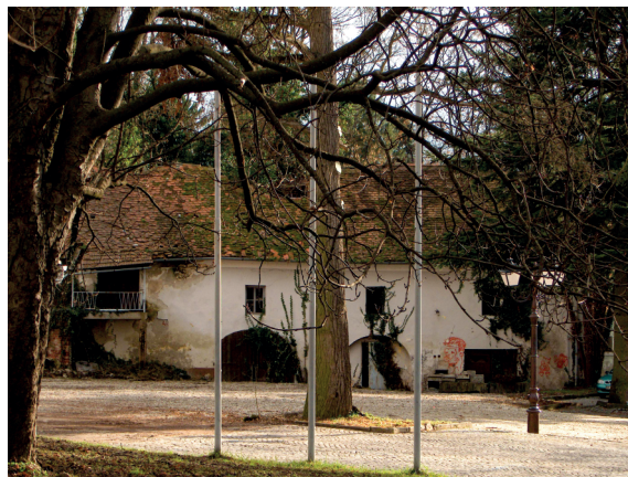
Grajska pristava pred obnovo.

Umetnostnozgodovinska pričevalnost ormoškega območja je zastopana na razstavi izbranih srednjeveških plastik, ki sodijo med vrhunske umetnine romanskega in gotskega sloga. Arheološka razstava popelje obiskovalca v prazgodovinsko obdobje (11.–1. stoletje pr. n. št.), ki je v Ormožu zapustilo mnoge najdbe, saj je bila tukajšnja prazgodovinska naselbina celo med večjimi naselbinami v Evropi. Stopnišče, ki vodi v prvo nadstropje, približa obiskovalcu še najdbe iz starejše in mlajše železne dobe ter manjšo etnološko razstavo lončarskih izdelkov iz preteklega stoletja. 4