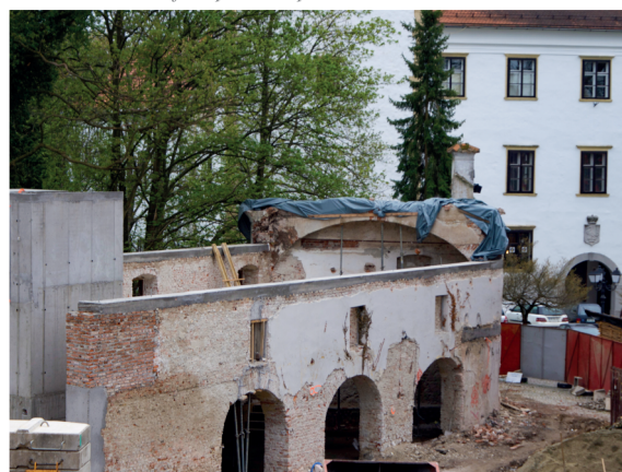
Pogled na Grajsko pristavo med obnovo.