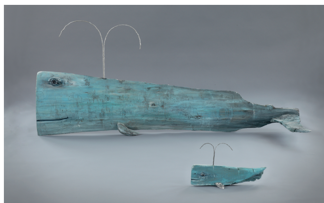
Skrivo v drevesih – pravljica skrivnost vznemiri dušo, ko zadiši vonj po sveže brušenem lesu in roka poboža rojevajočo se obliko. Takrat zazveni najlepša melodija, ki je bila desetletja zapisana med drevesnimi letnicami.

Od 8. oktobra 2013 do januarja 2014 smo razstavljali nekaj izbranih slikarskih in kiparskih del, ki so nastala na desetih mednarodnih likovnih kolonijah na Turistični kmetiji Hlebec na Kogu. Okrog šestdeset domačih in tujih umetnikov različnih poklicev, likovnih izobrazb in raznovrstnih slogovnih izrazov je pustilo v desetih letih ustvarjanja za seboj globoko umetniško sled v svojih številnih slikah, risbah, akvarelih in kiparskih umetninah, mnoge izmed njih so obiskovalcem še danes na ogled ob obisku kmetije.