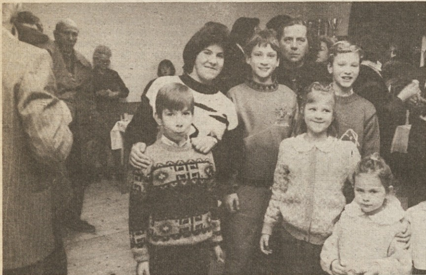
Skupina Lonjercev v novem domu