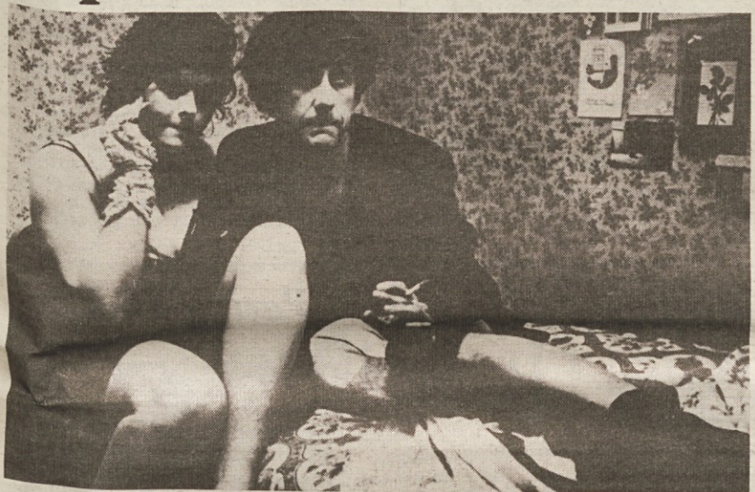
Posnetek iz filma Sweetie Avstralke Jane Campion