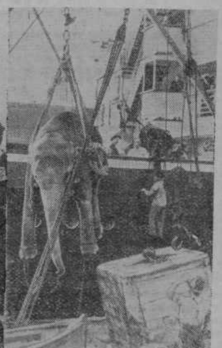
Z orjaškim žerjavom nakučajo na ladjo ogromnega slona za nek živalski vrt v Evropi

postavili telefonske aparate, ki so zvezani z najbližjima čuvajnicama na obeh straneh. Preden stopi gonjač s svojo čredo na progo, mora na obe strani najprej telefonično povprašati, ali je proga prosta in da li ni pričakovati v bližnjem času vlaka. Čuvaji tako zvedo, da prehod ni prost in v najslabšem primeru vlak lahko ustavijo, če prej ne dobe telefonskega obvestila, da na progah ni več črede.