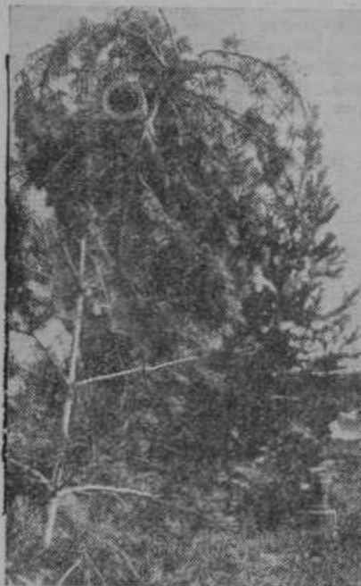
Zelo važno vprašanje je, kako skriti topove pred sovražnimi letalci. Silka nam kaže maskirani top

secu maju so se take molitve po želji papeža Pija XII. povsod vršile po katoliškem svetu. Sveti oče upa v učinkovitost teh molitev. Pri sprejemu 4000 romarjev v Vatikanu je izrazil ne samo nado, marveč tudi trdno prepričanje, da sile zlega ne bodo zmagale na svetu. V mesecu maju je tudi bilo veliko italijansko romanje v Padovi, kjer je na grobu sv. Antona molilo preko 300.000 ljudi za mir. Tudi v Franciji se v sedanjih dneh težke preizkušnje za ves narod mnogo, mnogo moli. V Parizu je bila v to svrhu slovesna služba božja, katere se je udeležila ne samo vlada po svojih zastopnikih, marveč tudi predsednik republike Lebrun s soprogo. Usodne izkušnje, ki so jih Francozi zadnje dni doživeli od brezbožniško usmerjenih sinov lastnega naroda, so jih prepričali, česa je sposoben brezbožniški materializem in marksizem. Oči Francije se obračajo navzgor, od koder pričakuje pomoč.