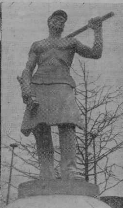
Orjaški kip, ki predstavlja delo, bo krasil vhod letošnje poletne razstave v Njujorku