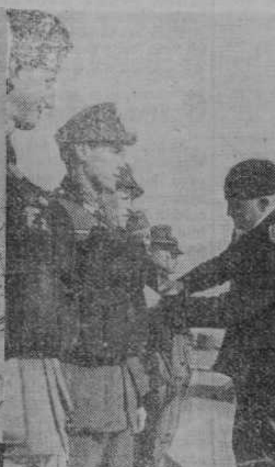
Nemške čete na potu na Norveško. Vojaštvo, katero je bilo ukrcano, so poučili glede rabe rešilnih pasov