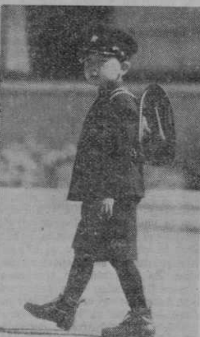
Na poti v šolo! Silka ne bi bila nič posebnega, če ne bi bil ta šolarček — japonski prestolonaslednik

»Tako, tako! Torej si ti tudi sovražna proti meni?« »Jaz sem proti tebi takšna, kakršen si ti proti meni.«