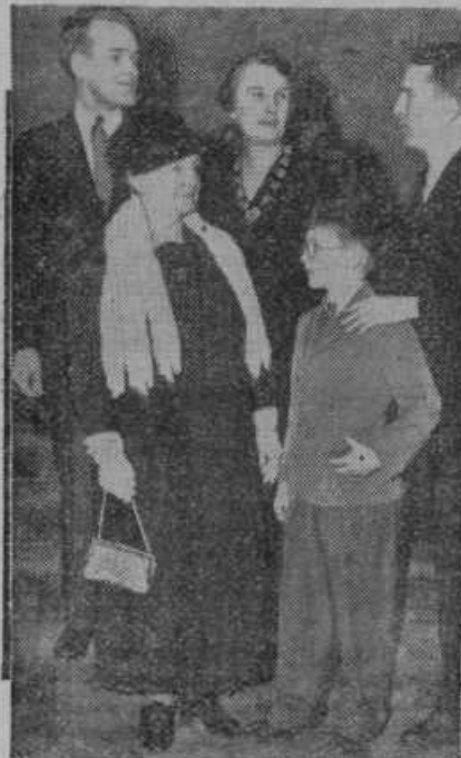
Na sliki vidimo ženo, hčerko in vnuke najslavnijšega ameriškega iznajditelja rajnega Tom. Edisona