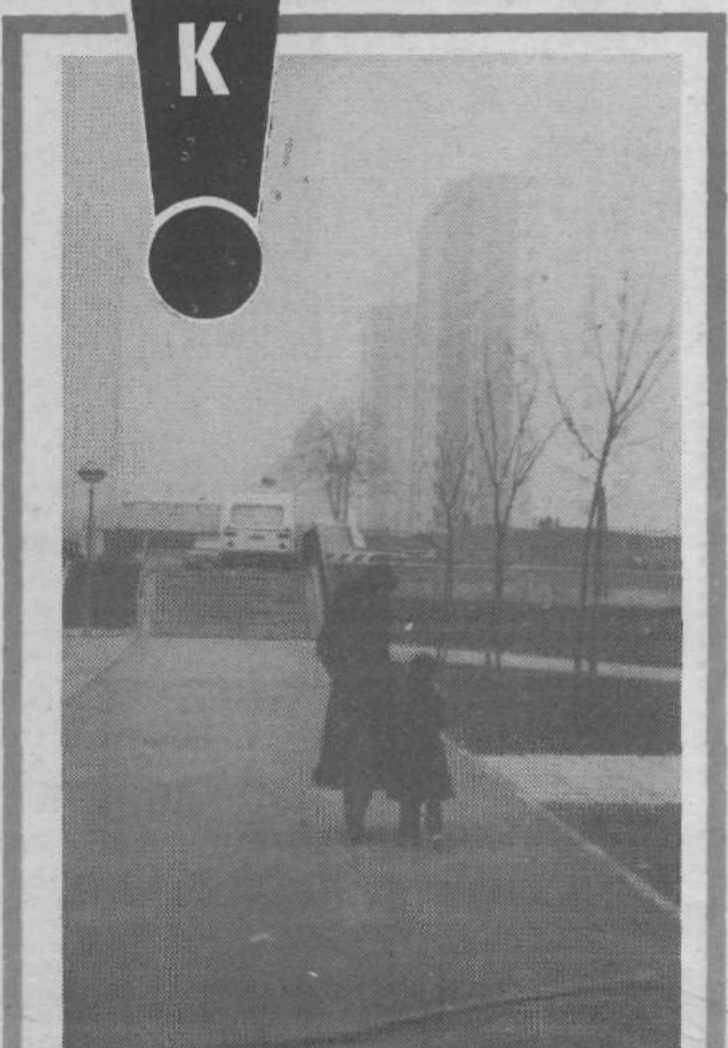
Pozna jesen in mladost sredi nje