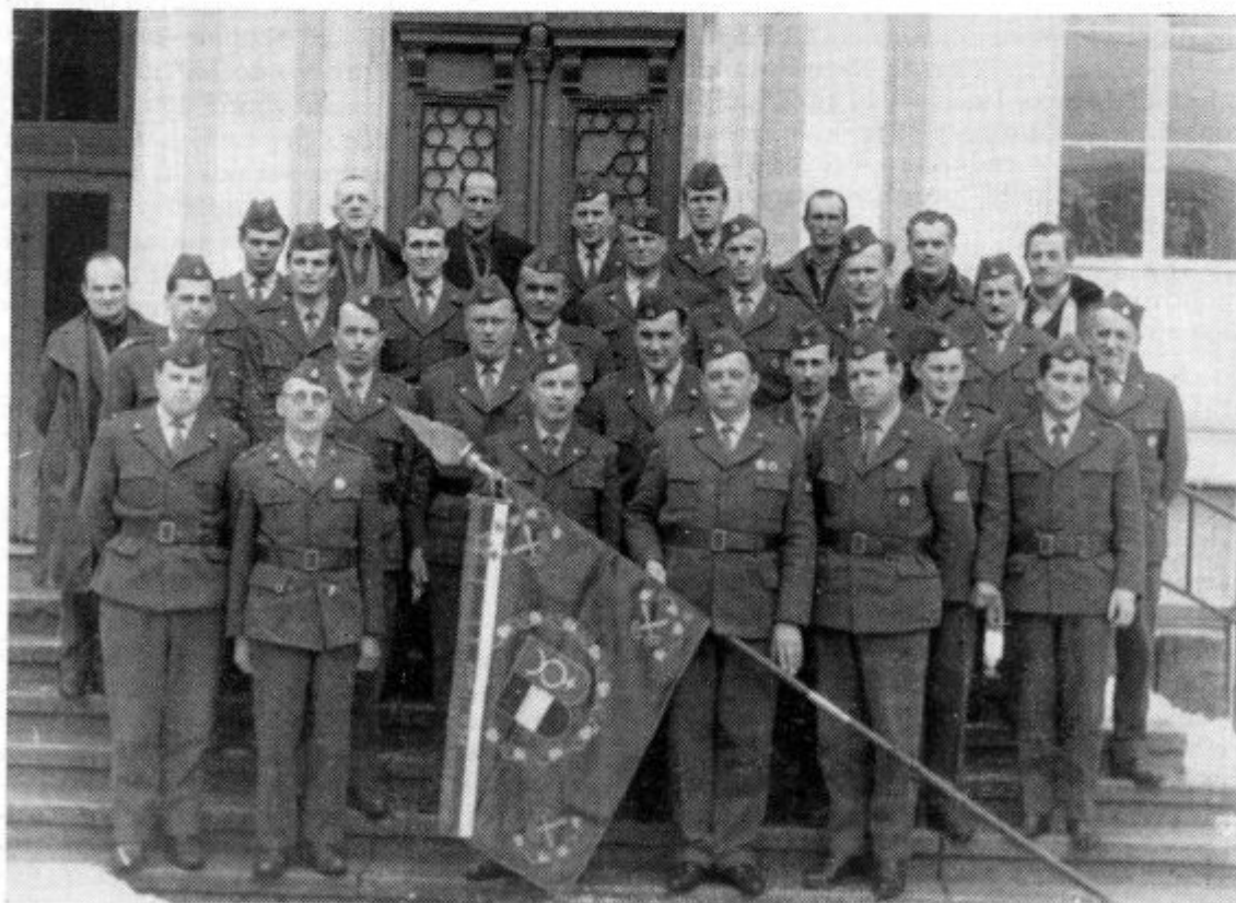
Naši gasilci leta 1965

Za uspešno delo je društvo prejelo zvezno odlikovanje. Uvrščeno je bilo v 17. kategorijo in zastopnik društva se je udeležil prvomajske parade v Beogradu v sklopu ešalona RGZ Slovenije.