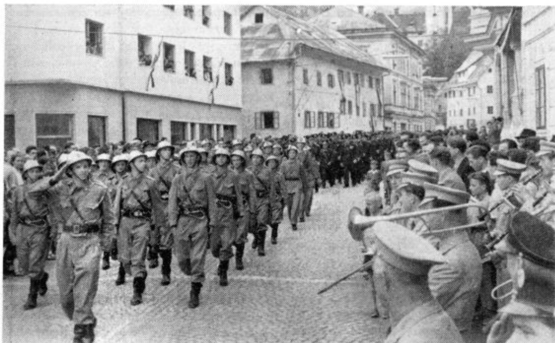
Gasilska parada 3. 6. 1956