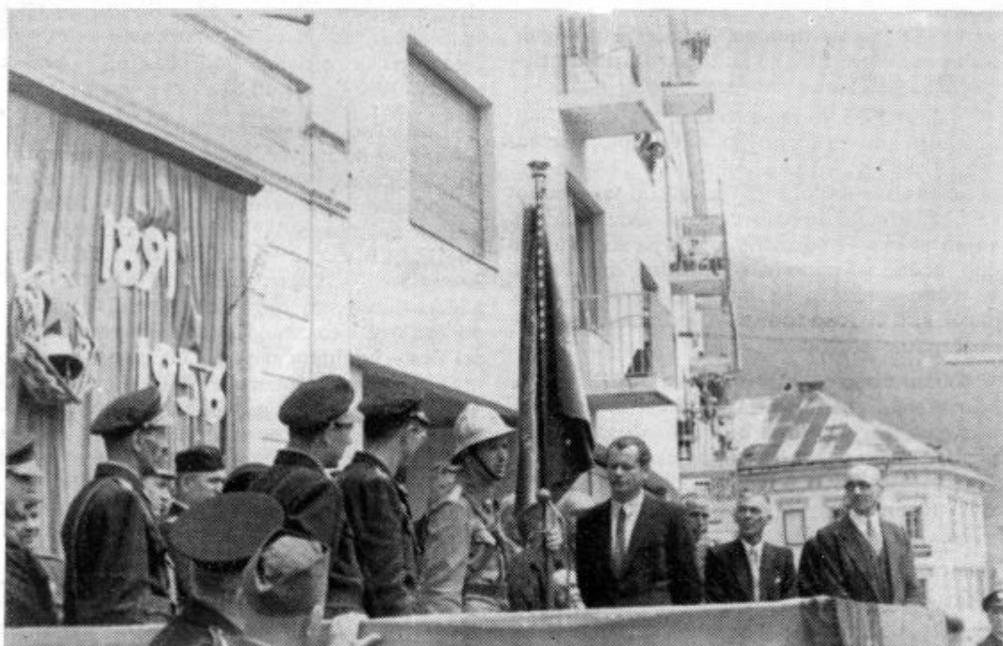
Proslava 65-letnice društva in 10-letnice PIGO — podaritev gasilskega prapora 3. 6. 1956