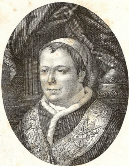
PAPPEZ PIJ IX. zvoljen 16. Rozniga cvéta. 1846.

Lith. u. Kunstl. von Gebr C. u. N. Benziger in Einsiedeln.