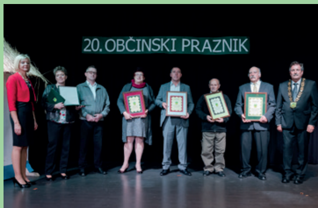
Dobitniki občinskih priznanj

Kvartetu Dobrinček je bilo podeljeno župansko priznanje.