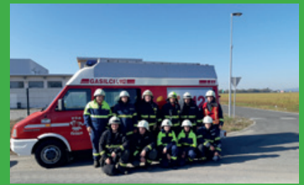
Člani PGD Žetale, ki so se udeležili operativne vaje GZ Videm v obrtni coni v Tržcu

Operativna vaja GZ Videm je potekala na območju občine Videm pod naslovom Neurje v Lancovi vasi. Na vaji so se izvajale naslednje aktivnosti: štabno vodenje intervencije večjega obsega, reševanje kriznih situacij ob neurjih, poplavalah, prometnih nesrečah in plazovih. Zaključek vaje je bil v Industrijski coni Videm pod predpostavko Požar v industrijski coni. Na vaji so sodelovala vsa društva GZ Videm. PGD Žetale je na vaji sodelovalo z dvema voziloma in 11 operativnimi gasilci. Skupaj je na vaji sodelovalo 70 operativnih gasilcev.