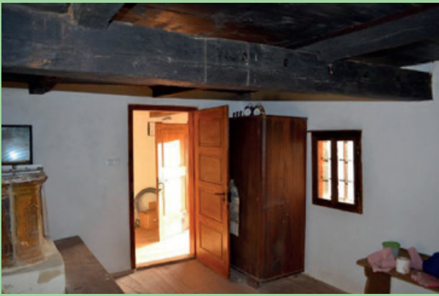
Osrednji prostor v hiši Pušnikove domačije.

bi prostore hiše opremili z opremo, ki bi omogočala nastanitev 4-5 članske družine. Nekaj izvorne opreme je ohranjene, hiša ima tudi krušno peč iz leta 1871. V prostorih gospodarskega poslopja (hleva in skednja) bi uredili skupna ležišča ter namestili kabino