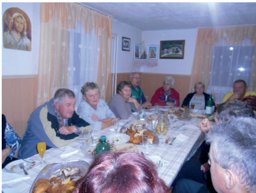
Likov po kožuhanju na kmetiji Jus v Dobrini, oktober 2019

Pokojna člana našega društva bomo ohranili v najlepšem spominu.