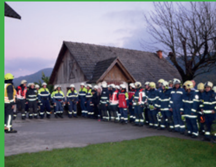
Zaključek operativne vaje PGD Žetale na kmetiji Pulko