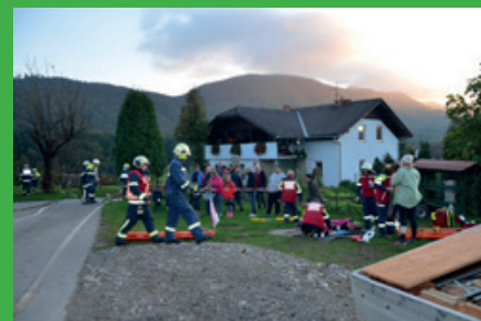
Gasilska vaja na kmetiji Pulko v Krhičah