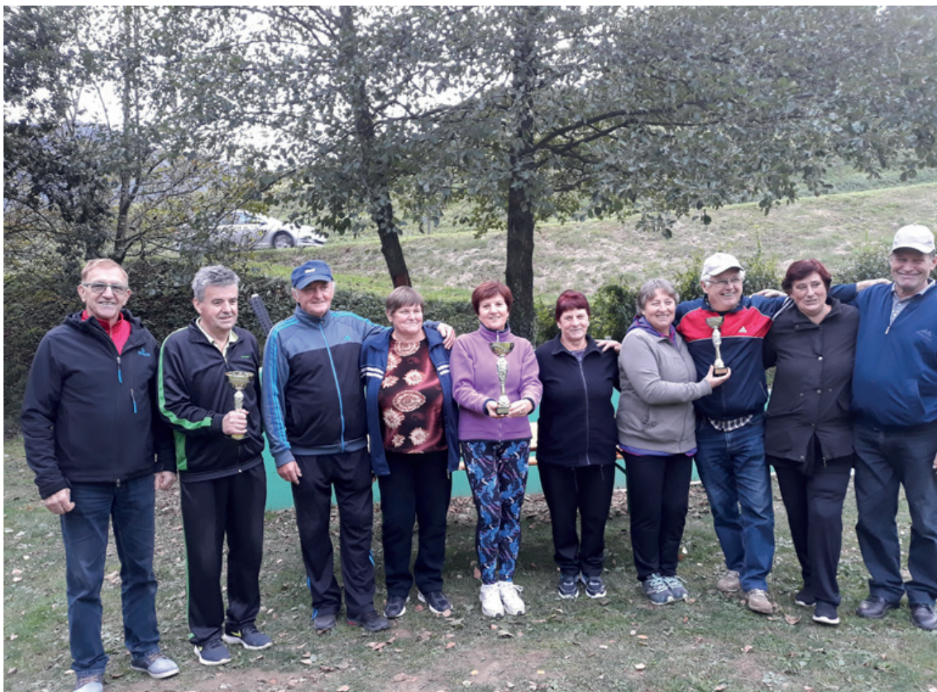
Prejemniki pokalov na 1. prvenstvu v balinanju v občini Žetale 6.10.2019

Društvo upokojencev Žetale je v soboto, 9. novembra 2019, organiziralo tradicionalno prireditev »martinovanje«, s katero je počastilo vinskega zavetnika sv. Martina. Martinovanja se je udeležilo 33 članic in članov DU Žetale. Kljub temu, da je bilo na martinovanju prisotnih manj udeležencev