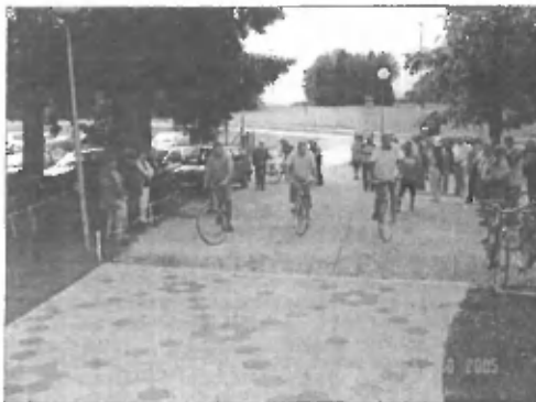
Težko je peljati hitro, še težje pa počasi in tudi ča to prejeti medaljo.