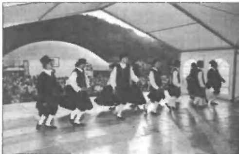
Folklorna skupina Val Resia, Italija