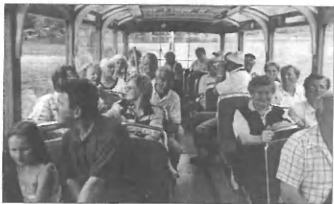
Izlet upokojencev na Vogel (29.6.2005) - z ladjico po Bohinjskem jezeru

Prijave za srečanje v Škofji Loki bodo zaključene do 14. avgusta, o tem pa vas bomo obvestili tudi z oglasnimi plakati.