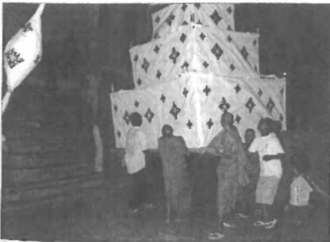
Praznovanje 1. polne lune po deževni dobi. Na sliki praznično dogajanje ob templju v mestecu Kraie.

Domačini so se tisti dan pripravljali na veliki festival ob polni luni. To smo opazili že tedaj, ko smo se očarani vračali z reke in so ljudje iz lupin kokosovih orehov ter iz cvetja in sveč izdelovali nekakšne ladjice, ki naj bi jih ob mraku spustili po reki navzdol. Središče dogajanja sta bila budistični tempelj in pagoda sredi mesta. Tam so se ljudje zbirali in čakali, da se festival prične. Nekateri so zavili v tempelj, kjer je potekal obred, v sklopu katerega so budisti eno uro izgovarjali mantrami oziroma molilne obrazce. Na dvorišču pred templjem pa so menihi, ki so jih spremljale radovedne oči laikov, pripravljali ogromno papirnato piramido iz kartona, ki je izgledala kot mogočna poročna torta - okrasili so jo namreč s svečami in drugim okrasjem. Na vrh »tortex« so nato na visoki palici zapičili velikga papirnatega belega ptiča, ki je verjetno simboliziral mir. Ko je bilo