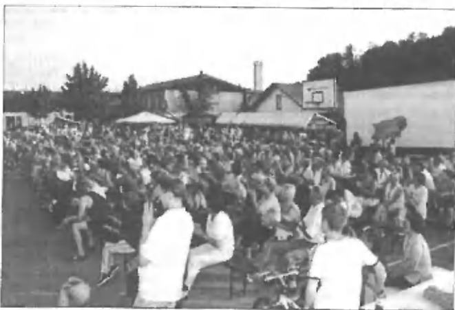
Pogled na obiskovalce

Osnovni šoli Trzin, Tiskarni Ozimek iz Trzina, podjetju Šotori »Petra« iz Žalca, Banki Domžale d.d. iz Domžal, podjetju Gama trgovina d.d. iz Trzina, kmečkemu turizmu »Blaž« z Dobena, gostilni »Pri Narobet« iz Trzina, podjetju Vrtnar, avtobusni prevozi iz Srednje vasi, Pekarni Krejan iz Trzina, Vinski kleti Uršič iz Trzina, Cvetličarni »Ciklama« iz Trzina, Radiu Veseljak iz Ljubljane, PGD Trzin, podjetju Taubi – tenis iz Trzina ter številnim