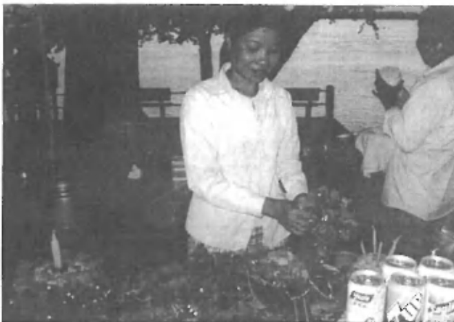
Ženska pripravlja cvetlične ladjice s svečo v sredini - zvečer jih bo spustila po reki (praznik polne lune)

Tam smo se vkrčali na čolni in se lagodno pomikali po reki, iz katere so poganjala drevesa in grmičevje, da ne bi splašili delfinov. Ko smo bili že dovolj oddaljeni od brega, je krmar ustavlil čoln, mi turisti pa smo polni pričakovanja prežali za plavutmi teh sladkovodnih sesalcev, ki so se vsake toliko časa za hip pokazale iz vode. Kajti zelo redkim je dano videti, da bi se celo delfinovo telo pognalo iz vode in naredilo lok nad gladino. Smo pa zato lahko opazovali oranžen sončni zahod, ki je počasi legal na gugajočo se vodno površino in se pogreznil v njene globočine. Pri Vel'ki Ž'vini je bilo moč organizirati tudi ogled po podeželju ali pa najeti kolo. Dalo pa bi se dogovoriti še za marsi-