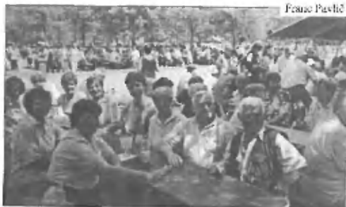
Srečanje upokojencev v Postojni (23.6.2005)