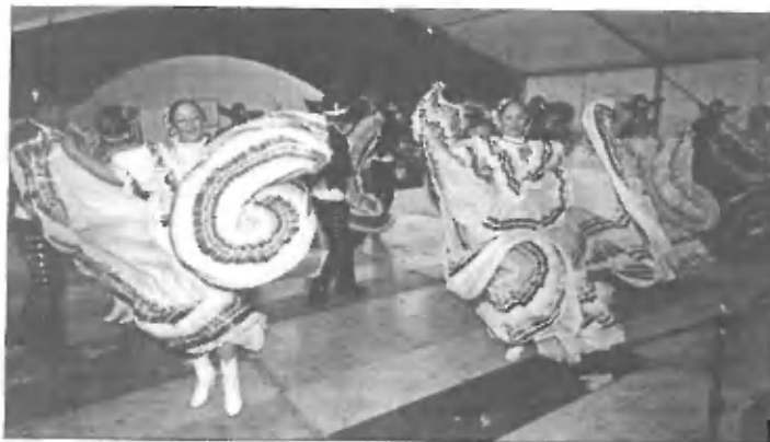
Folklorna skupina Policromia Mexicana, Mehika

posameznikom in članom TD, ki so v materialu ali osebno sodelovali pri organizacijsko - tehničnih pripravah in izvedbi prireditve.