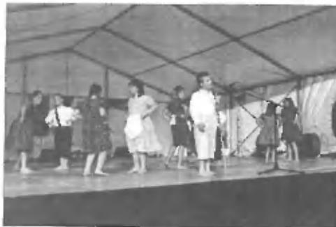
Folklorna skupina OS in TD Trzin