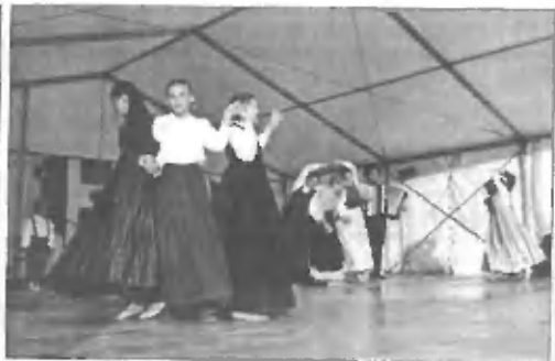
Folklorna skupina OŠ Domžale