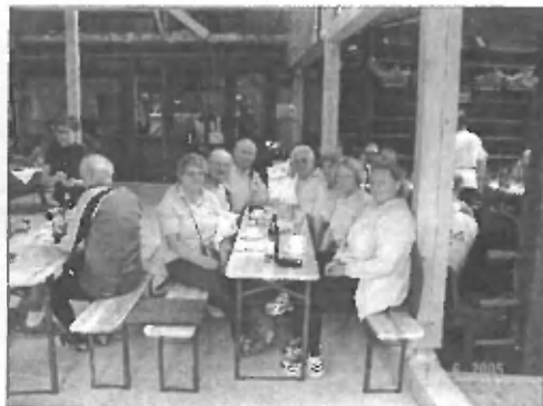
Udeleženci iz Trzina na srečanju kolesarjev Gorenjske na Kokrici.