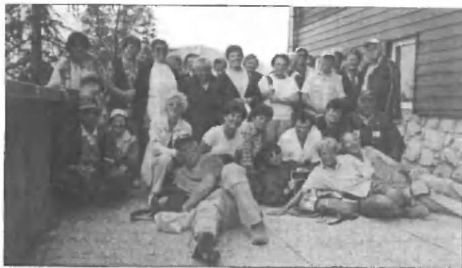
Izlet upokojencev na Vogel (29.6.2005)