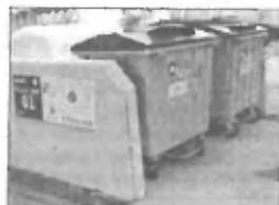
Ekološki otok

Embalaža izdelkov je praviloma izdelana iz kakovostnih materialov. Če jo ustrezno predelamo v sekundarno surovino, lahko tako dobljen material še enkrat uporabimo za različne izdelke. Iz plastike, pridobljene iz odpadne embalaže, se tako izdelujejo ohišja za svinčnike, vžigalnike, različne cevi, vrečke... Iz lesene embalaže (na primer palet), se izdelava furnir, iz papirja in kartona se izdelujejo papirnati polizdelki, steklo pa se predelava v steklene polizdelke. V takem primeru se kakovostna surovina ponovno uporabi, preden v enem od svojih naslednjih »življenj« kot končni izdelek konča na deponiji odpadkov.