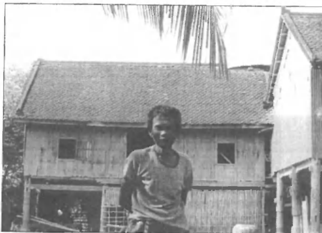
Domačin pred tradicionalno leseno hišo na kolih

cilju, postal nenavadno nemiren. Tekal je po avtobusu gor in dol, od turista do turista, se sklanjal k njim in jim zavzeto