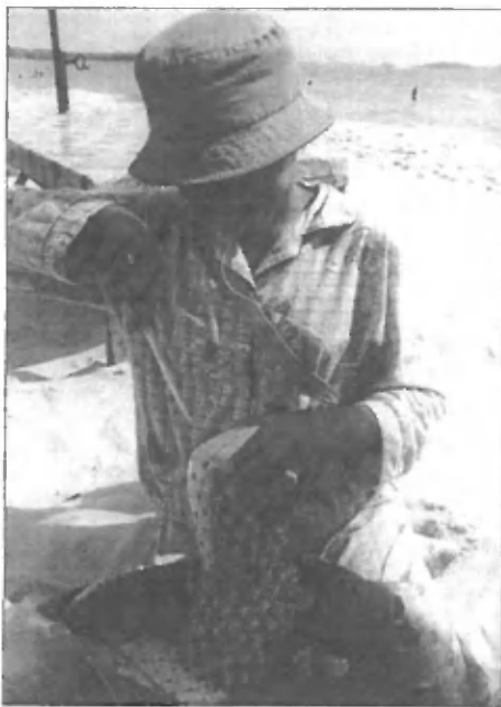
Prodajalka sadja na plaži (Sihanohville)

V hiši, kjer sva se nastanili, se nama je pripetila nič kaj prijetna dogodivščina. Bili sva pač nepazljivi in preveč frfotavi, čeprav, o tem sem prepričana, je k vsemu pripomoglo tudi stranišče, ki ni ravno dobro požiralo. In čeprav sva kot popotnici vedeli, da v tamkajšnja stranišča ni dobro metati toaletnega papirja, je Katja to na veliko počela, no, jaz pa tudi. In potem se je seveda stranišče zamašilo. In ni hotelo požirati, pa čeprav sva vanj zlivali neomajne količine vode. Pa tudi kovinski obešalnik, ki sva ga tako uničili, se pravi sploščili in ukrivili, da je bilo z njim mogoče drezati v školjko, prav nič pomagalo. Stranišče je bilo do pokrova polno zdrizaste rjave brozge, ki ni hotela usahniti niti za milimeter. Ni nama ostalo drugega, kot da na vse skupaj poskušava pozabiti in se s tem ne obremenjevati več. Toda, da nama bo stranišče poglajalo toliko strahu v kosti, si nisva mislili. Ko sva namreč odšli spat in so po stenah najine sobe mirno drobencljali mali kuščarji gekoni, ki pridno jedo komarje, se je zgodilo nekaj nenavadnega – zaslišali sva globoko hreččenje. Nenadoma sva se obe zbudili in planili v zrak. »Kaj je bilo to,« sva vprašali ena drugo in se prestrašeno gledali. »Podgana,« sem siknila. »Gotovo je podgana