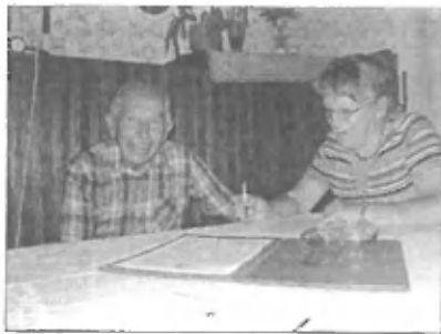
Razgovor je bil zelo sproščen in prijeten